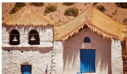
Figura 1 ALGUNOS DE LOS PRINCIPALES ATRACTIVOS TURÍSTICOS EN CHILE

Iglesia Machuca, ubicada a 27 Kms. de San Pedro de Atacama a una altura de 4.115 metros sobre el nivel del mar.