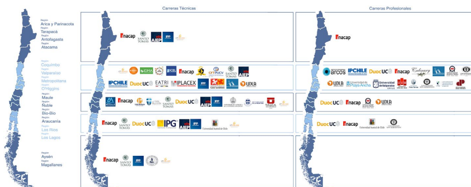
Figura 2 ESQUEMA DE DISTRIBUCIÓN GEOGRÁFICA DE LAS INSTITUCIONES DE EDUCACIÓN SUPERIOR EN CHILE, QUE OFRECEN CARRERAS TÉCNICAS Y PROFESIONALES DEL ÁREA DE TURISMO. LA DISTRIBUCIÓN ESTÁ AGRUPADA SEGÚN MACROZONAS GEOGRÁFICAS QUE INCLUYEN MACROZONA NORTE, MACROZONA CENTRO-NORTE, MACROZONA CENTRO-SUR, MACRO-ONA SUR Y MACROZONA AUSTRAL DE CHILE