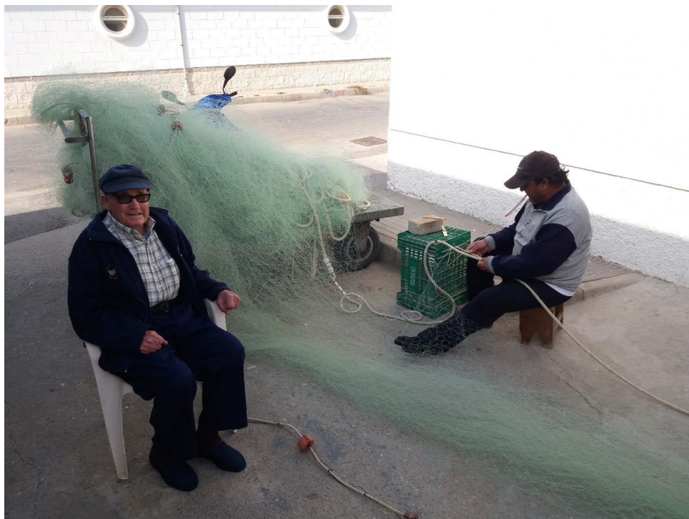
Figura 1 PESCADORES REMENDANDO REDES EN PUERTO DE MAZARRÓN. REGIÓN DE MURCIA

pesqueros (degustaciones gastronómicas, visitas a las lonjas y a las instalaciones portuarias (Figura 1), talleres de nudos o rutas guiadas por elementos patrimoniales que tienen relación directa o indirecta con la pesca) y en el mar (visualización in situ de la jornada de pesca), lo que se conoce como pesca-turismo (Moreno, 2018). Por ende, tal y como afirman Herrera-Racionero et al. , (2018), se trata de propuestas novedosas que responden a la necesidad de diversificación de la actividad pesquera y turística. No obstante, tal y como indican Caamaño et al. , (2021) no se puede afirmar que el turismo marino sea una vía complementaria de ingresos para el sector pesquero dado que, mayoritariamente, las empresas implicadas son turísticas. Sin embargo, la labor que realizan de cara a la puesta en valor de la cultura marítima es indudable y de este modo se está favoreciendo la conservación y promoción de la pesca y toda su cultura.