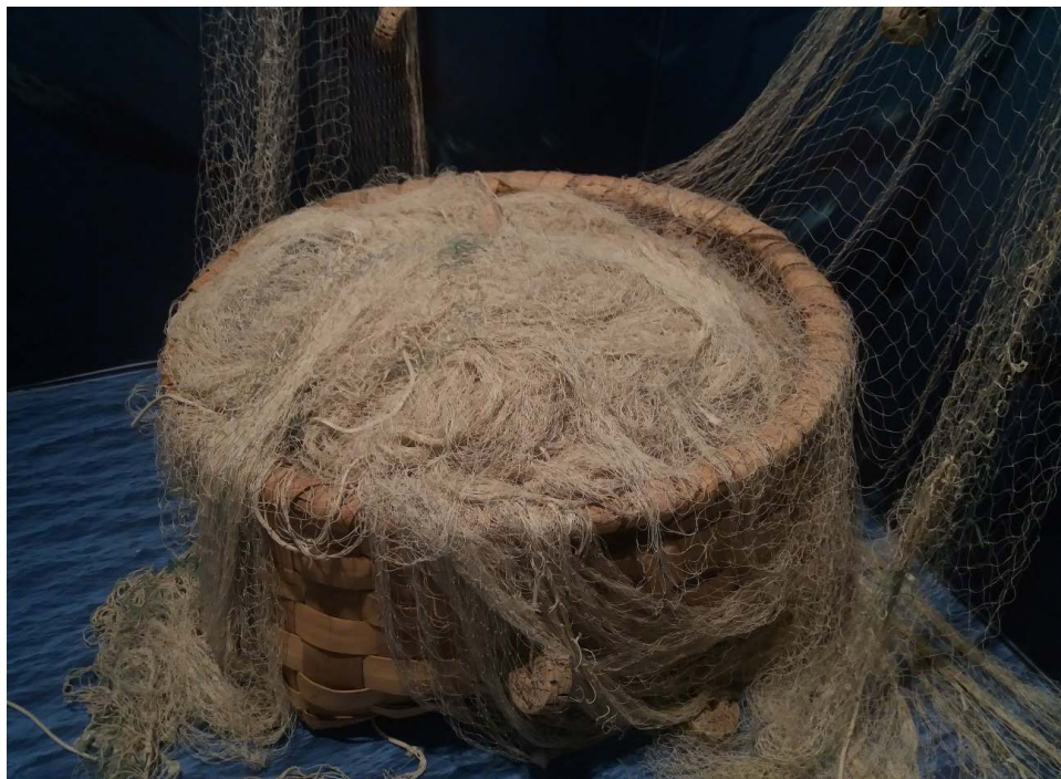
Figura 2 DETALLE DE ARTE DE PESCA EN EL MUSEO DA MEMORIA MARÍNEIRA. PORTO DO SON. GALICIA