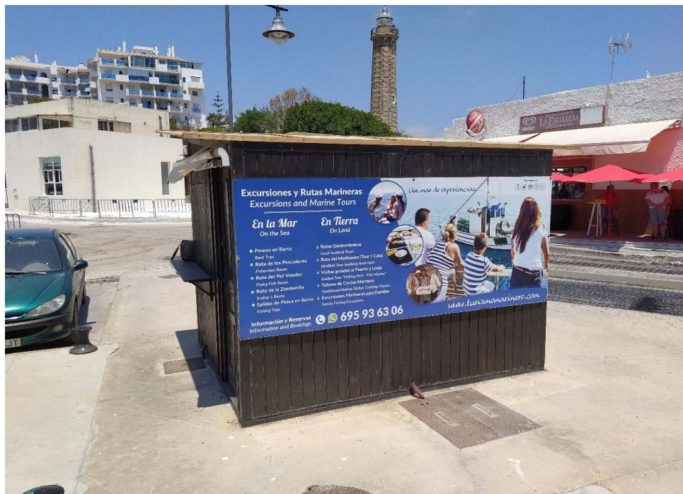
Figura 3 EMPRESA DEDICADA A LA OFERTA DEL TURISMO MARINERO EN ESTEPEONA. MÁLAGA