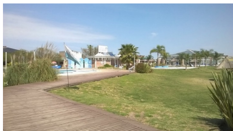
Figura 5 VISTA DEL ESTABLECIMIENTO TERMAS DEL GUAYCHÚ Y RESERVA NATURAL