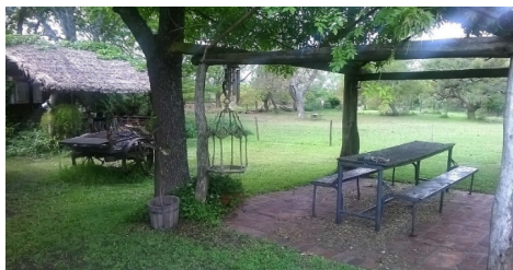
Figura 2 VISTA DEL ESTABLECIMIENTO DE TURISMO RURAL ITAPEBY