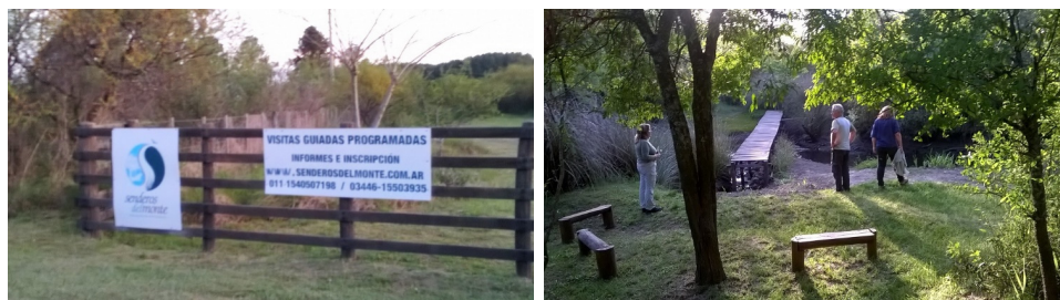
Figura 4 VISTA DE LA RESERVA NATURAL SENDEROS DEL MONTE