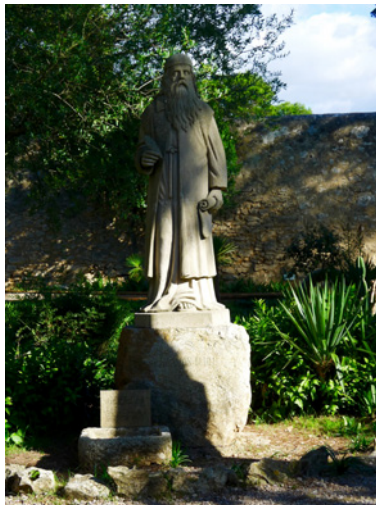
Figura 3 ESCULTURA DE RAMÓN LLULL. SANTUARIO DE CURA

Al parecer, el primer ermitaño de Mallorca fue Diego Espanyol instalado junto a las ruinas de un templo romano de la antigua Pollentia, donde construyó su ermita. Junto a ella se levantó otra de mayores dimensiones dedicada a Santa Ana (Un ermitaño, 1965: 14). No obstante, fue Ramón Lluïl quien implantó y popularizó la vida eremítica en la Isla