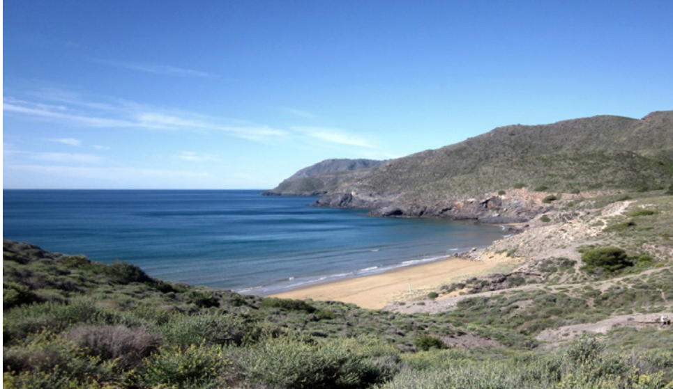
Figura 1 PLAYA DEL PARQUE REGIONAL DE CALBLANQUE, MONTE DE LAS CENIZAS Y PEÑA DEL ÁGUILA