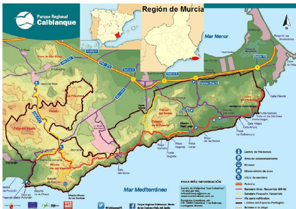
Figura 2 LOCALIZACIÓN DEL PARQUE REGIONAL DE CALBLANQUE, MONTE DE LAS CENIZAS Y PEÑA DEL ÁGUILA

Dentro del propio Parque Regional, las Salinas del Rasall, que ocupan una superficie de 18 hectáreas, forman parte de la Zona de Especial Protección para las Aves (ZEPA) Mar Menor (Unión Europea, 2009), contando con una interesante avifauna acuática. Además de ser incluidas, también junto al Mar Menor, con el número 706, en la Lista de Humedales de Importancia Internacional del Convenio de Ramsar (Consejo de Ministros, 1994).