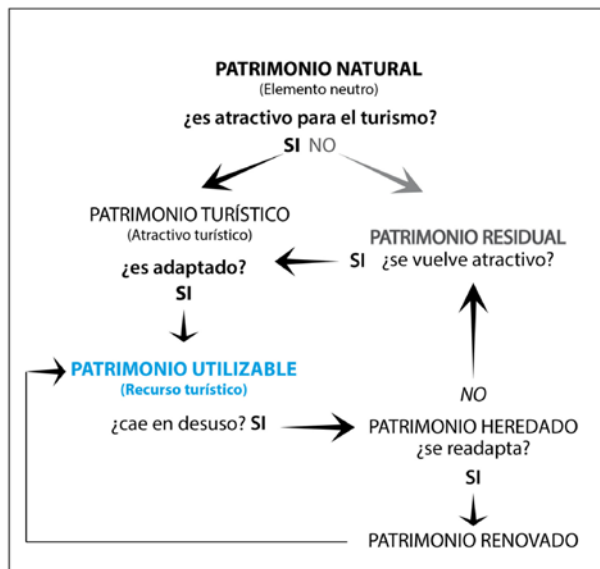
Gráfico 3 TEORÍA DE LA RENOVACIÓN DEL PATRIMONIO TURÍSTICO