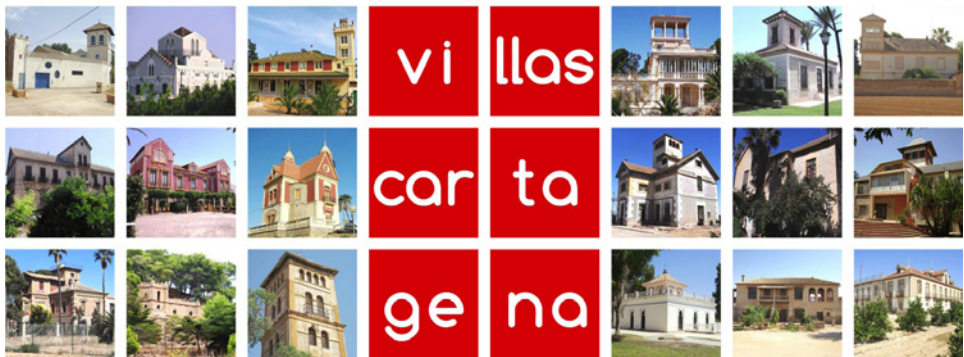
Figura 4 VILLAS DE CARTAGENA, SIGLOS XIX-XX

Esto ha tenido fiel reflejo en la expresión arquitectónica de la comarca del Campo de Cartagena (Figura 4), donde dispersas por la amplitud de tu territorio se encuentran toda una serie villas modernistas y eclécticas que, al igual que las vénetas, tienen una esencia atractiva e inspiradora que las diferencia de las construcciones rurales convencionales.