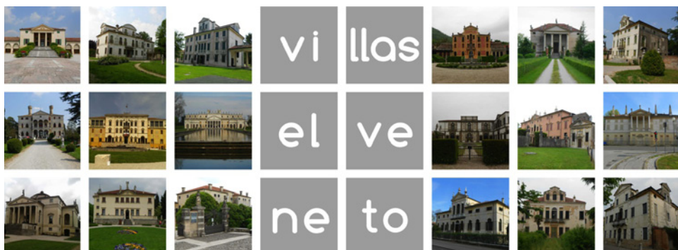
Figura 2 VILLAS DEL VÉNETO, SIGLOS XV-XVIII

Tras la caída del Imperio Romano de Occidente en el siglo V, las ciudades europeas se convirtieron en objeto de constantes saqueos, por lo que la mayor parte de la población se concentró en torno a las fortalezas en busca de protección. En consecuencia, la cultura de la villa cayó en abandono y acabó siendo sustituida por la del castillo medieval (Ackerman, 1990: 63). No fue hasta finales de la Edad Media, casi diez siglos después, cuando resurgió con fuerza, principalmente en la Toscana y el Véneto italianos (Figura 2). Mucho tuvieron que ver en ello Leon Battista Alberti 1 , y sobre todo, Andrea Palladio 2 , sin duda el arquitecto que de una manera más significativa ha influido en el desarrollo de esta tipología residencial, tanto en Europa como en el resto del mundo (Moriani, 2008: 91).