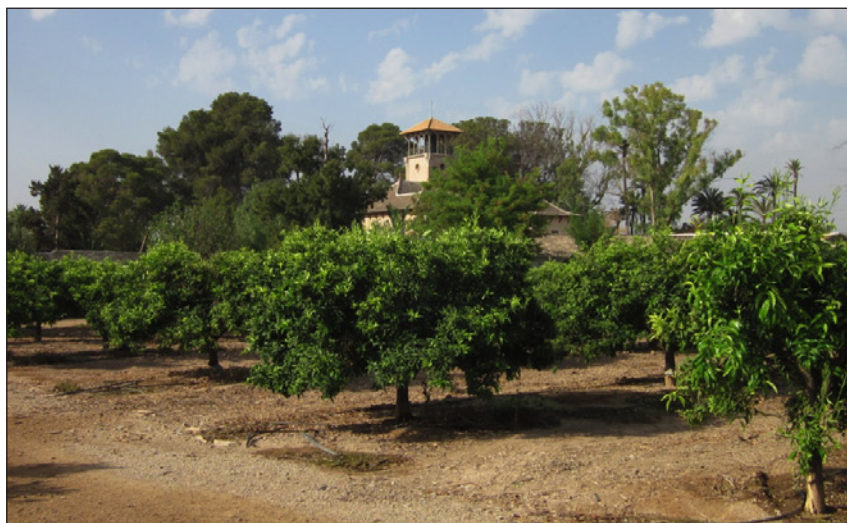
Figura 1 VILLA ANTONIA. FUENTE ÁLAMO, 1894

cultivo (Figura 1). Estas singulares villas dispersas en las proximidades de la ciudad y de los pueblos de la zona se han convertido en puntos referenciales de la percepción estética de su campo, en hitos arquitectónicos de un paisaje cultural que, más allá del reconocido valor artístico y estético, conservan todavía legibles aspectos etnográficos y antropológicos que merecen ser descubiertos, rasgos todos ellos fruto de la sociedad burguesa del siglo pasado que supo transformar los factores de producción agrícola elaborando un entorno natural en equilibrio entre los requerimientos económico-productivos y los paisajísticos.