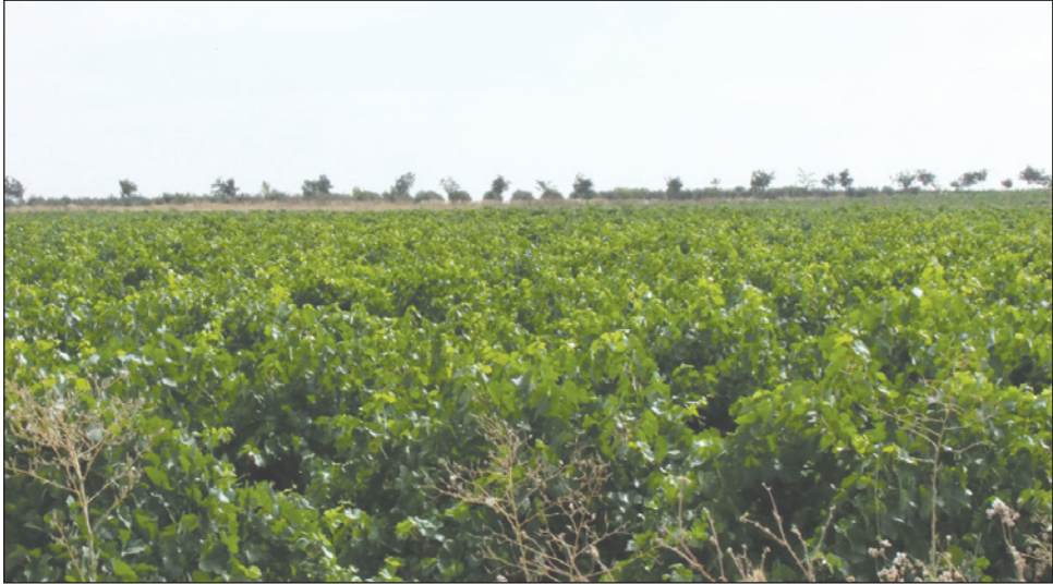
Figura 3 PAISAJE DE VIÑEDO TRADICIONAL EN LA ZONA DE VALPEDEÑAS (CIUDAD REAL, CASTILLA-LA MANCHA)