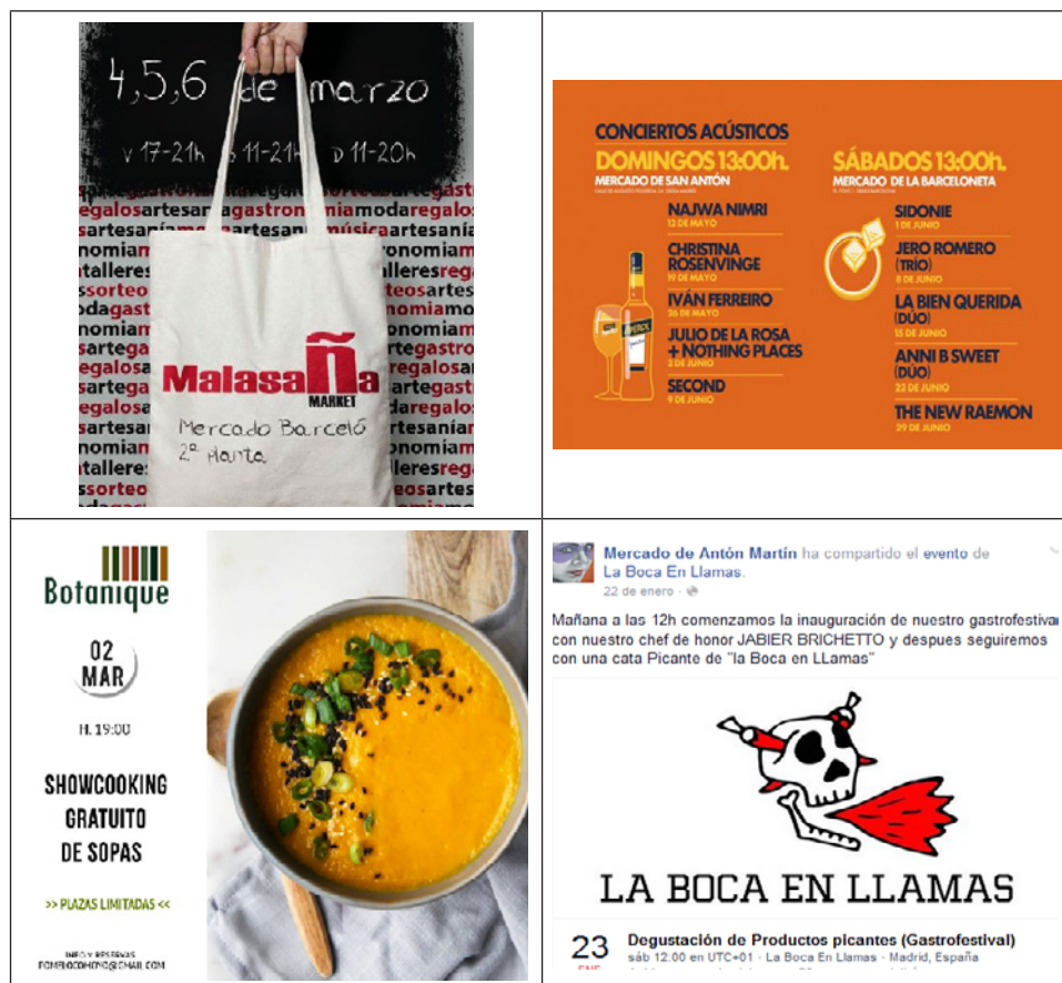
Figura 3 INFORMACIÓN SOBRE ACTIVIDADES CULTURALES Y DE OCIO EN LOS MERCADOS DE MADRID