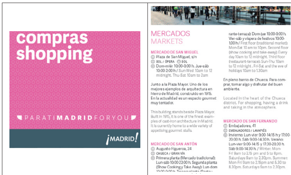
Figura 4 INFORMACIÓN RECOGIDA EN LA WEB DE TURISMO SOBRE EL TURISMO DE COMPRAS Y, EN CONCRETO, SOBRE LOS MERCADOS DE ABASTOS

Todos los mercados han sabido sacar provecho a lo bellos de sus renovadas instalaciones para sobrepasar la vía de venta de gastronomía y entrar en la dimensión de la cultura social, convirtiéndose en lugares donde vivir una experiencia gastronómica completa.