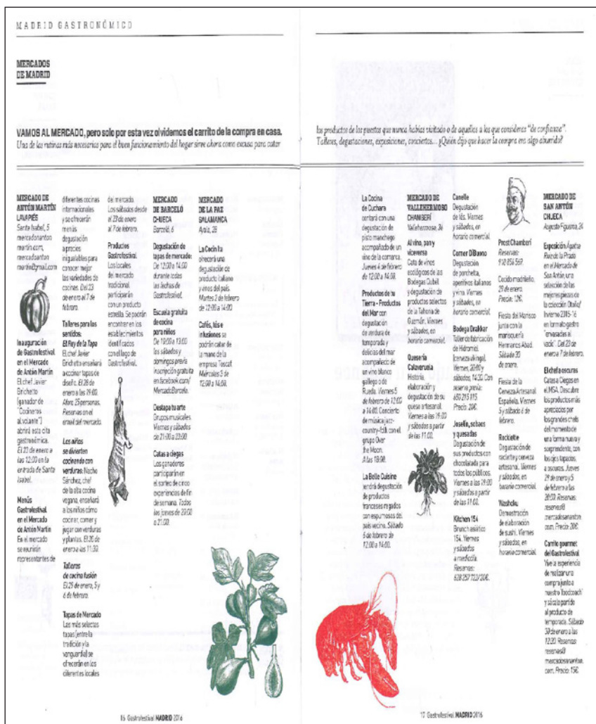
Figura 7 FOLLETO INFORMATIVO DEL GASTROFESTIVAL 2016, SECCIÓN DEDICADA A LOS MERCADOS DE ABASTOS

El enorme impacto que la Web 2.0 y 3.0 tiene en la actividad turística alcanza a proveedores, oferentes y consumidores. El “boca oreja”, tan importante en el marketing turístico, se ve ahora potenciado por los miles de contactos que un usuario activo en internet puede generar mediante blogs, correo electrónico, su cuenta de Facebook, Twitter, Instagram, etc.