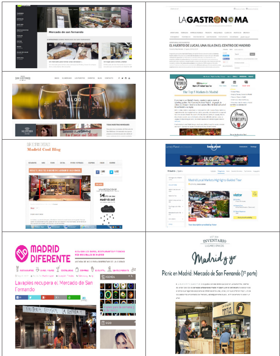
Figura 10 COMUNICACIÓN POR MEDIO DE POST EN BLOGS DE REFERENCIA A NIVEL GASTRONÓMICO Y DE OCIO