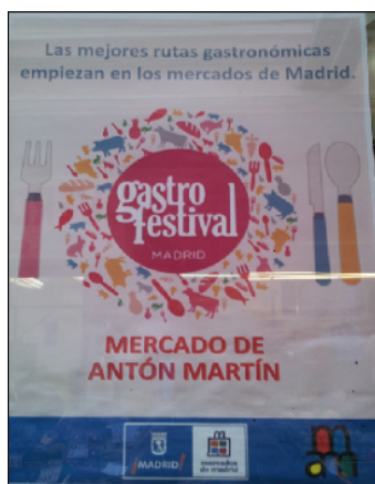
Figura 6 CARTEL PROMOCIONAL DE GASTROFESTIVAL 2016 EN EL MERCADO DE ANTÓN MARTÍN