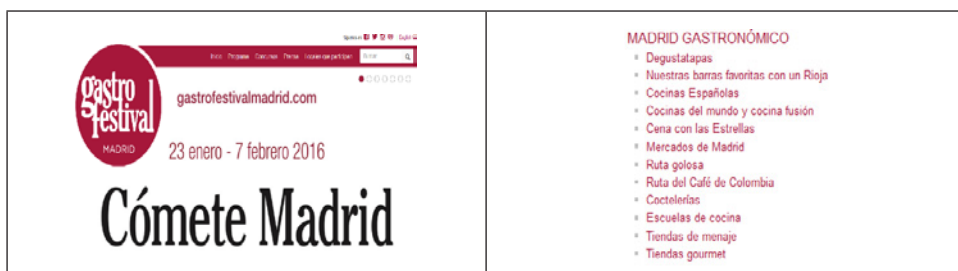
Figura 5 WEB PROMOCIONAL GASTROFESTIVAL 2016 CON ACTIVIDADES EN LOS MERCADOS

Los puestos vacíos han sido recuperados por cocineros y emprendedores transformando los mercados en lugares donde vivir “vivir una experiencia gastronómica” y, por tanto, una oferta adaptada a las nuevas exigencias de los consumidores turísticos en busca de lo “local”.