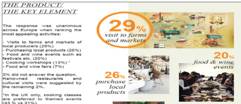
Figura 2 ACTIVIDADES REALIZADAS POR LOS VIAJEROS QUE BUSCAN EXPERIENCIAS GASTRONÓMICAS