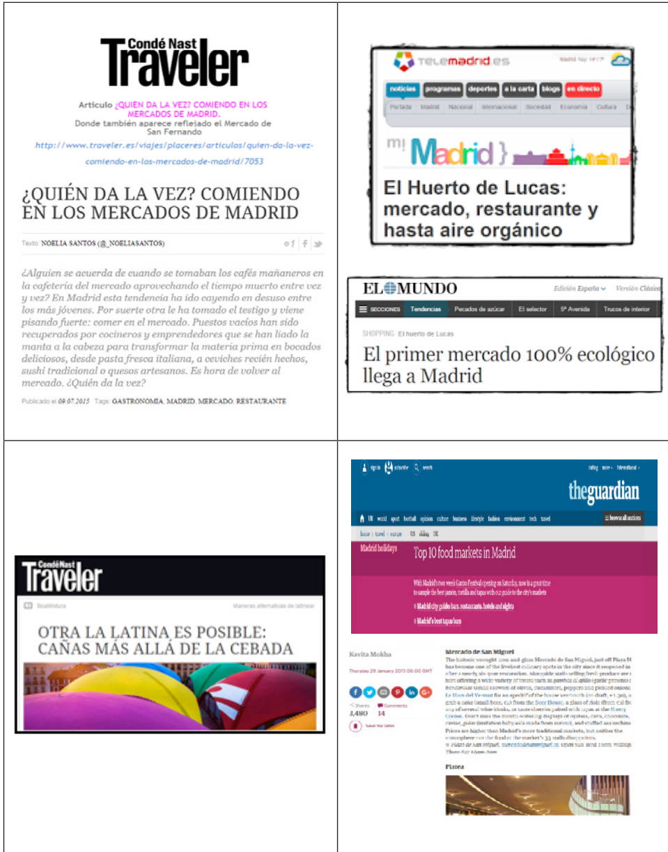
Figura 9 ARTÍCULOS DE PRENSA OFRECIENDO NOTICIAS SOBRE LOS MERCADOS DE MADRID