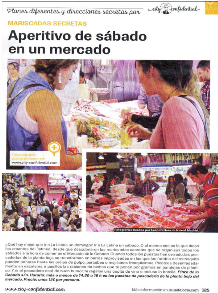
Figura 11 ANUNCIO EN LA GUÍA DEL OCIO DE MADRID DEL BLOG MADRID CONFIDENCIAL SOBRE ACTIVIDADES GASTRONÓMICAS EN EL MERCADO DE LA CEBADA