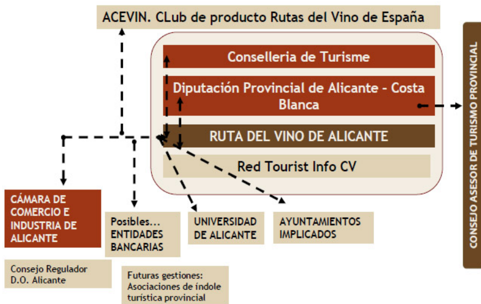
Figura 3 ENTRAMADO PÚBLICO-PRIVADO DE LAS RELACIONES DE LA RUTA DEL VINO DE ALICANTE