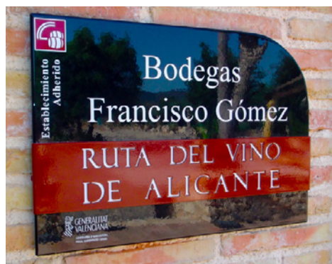
Figura 4 SEÑALÉTICA ACTUAL DE LA RUTA DEL VINO

El 13 de mayo de 2014, se aprobó en la XX Asamblea de ACEVIN, celebrada en Jerez de la Frontera, la certificación de las rutas del Vino de Alicante y Campo de Cariñena. Eso ha resultado un gran éxito para los municipios y las empresas de producción y servicios, vinculados al vino y a la restauración de Algueña, L'Alfas del Pi, Monovar, Novelda, Petrer, Pinoso, Salinas, Villena y la Mancomunidad de la Vall del Pop. La última estadística del Observatorio Turístico Nacional, sobre enoturismo en España, en 2013, cifraba en 1.430.592 el número de visitantes a bodegas, un aumento del 16'4% respecto al año anterior. En el caso concreto de la provincia de Alicante según datos publicados por la Denominación de Origen Vinos de Alicante, el interés por la viticultura atrajo en 2013 a 31.000 personas. Sin ir más lejos, la bodega Francisco Gómez, en el término municipal de Villena, recibía en el año 2009 a 2.000 visitantes y en 2014 recibió a 6.300 visitantes 14 . En este sentido, no es de extrañar que hayan bodegas en Alicante que nacen enfocadas hacia el enoturismo. De hecho la venta en bodegas alcanzó en 2014 porcentajes que superaron el 20% de las ventas totales, según la gerente de la ruta del vino de Alicante.