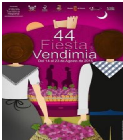
Figura 6 FIESTA DE LA VENDIMIA EN JUMILLA