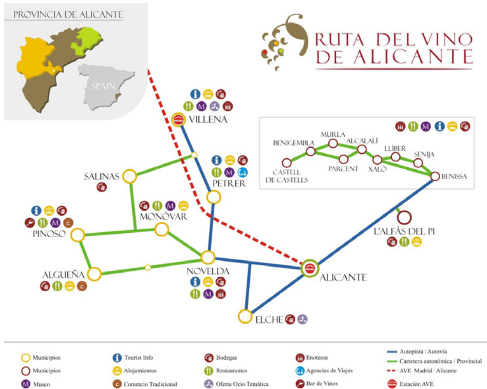
Figura 2 DISTRIBUCIÓN DE LAS COMARCAS ENOLÓGICAS DE LA PROVINCIA DE ALICANTE