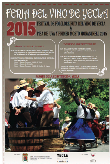
Figura 9 CARTEL ANUNCIADOR FERIA DEL VINO DE YECLA

Fuente: Asociación Ruta del Vino de Yecla.