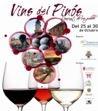
Figura 5 PROMOCIÓN VINOS DE PINOSO