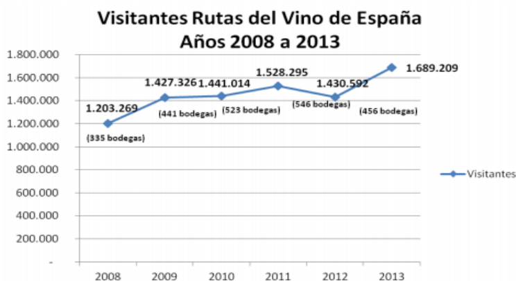
Figura 1 AUMENTO DE LOS VISITANTES A LAS RUTAS DEL VINO (2014)

En el contexto actual el turismo enológico se consolida en España como complemento al turismo de sol y playa y como uno de los motores del turismo rural y de interior, según los datos recogidos en el Informe del Observatorio de las Rutas del Vino en 2012 y que presentó ACEVIN. En efecto, la Asociación Española de Ciudades del Vino, contaron con un total de 1.430.592 visitantes. En el informe se plasma una pérdida de 97.703 visitantes respecto a 2011, año en el que se alcanzó la cifra de 1.528.295 visitantes, considerando los datos de 546 bodegas de 22 Rutas del Vino. Sin embargo, se tiene que matizar esa cifra porque el número de bodegas incluidas es mucho menor en el informe de 2012, contabilizándose 90 bodegas menos 2 que en 2011 (ACEVIN, 2013) 3 . Por lo tanto, a fecha de 2015, existen 21 rutas de Vino certificadas por TURESPAÑA, entre las que se encuentran los tres objetivos de estudio (Yecla, Jumilla y Alicante).