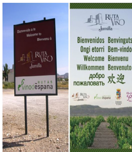
Figura 7 SEÑALÉTICA DE LA RUTA DEL VINO JUMILLA