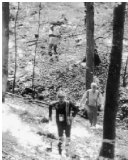
Orientadores en el bosque.

interpretar el plano en condiciones de fatiga... no es necesaria una impecable preparación física, pues lo importante no es llegar pronto, sino llegar al sitio exacto. Quien ha conocido la orientación, asegura que es un deporte apasionante.