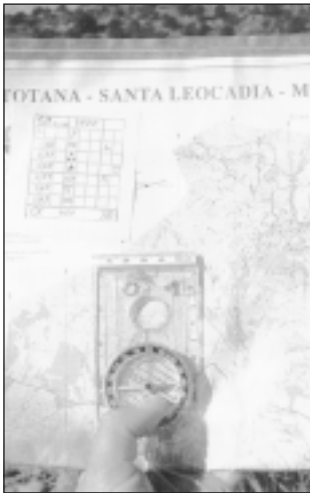
El mapa y la brújula.

Los recorridos están adaptados a la edad, sexo y experiencia de los participantes, existiendo un gran número de categorías adaptadas a todas las necesidades.