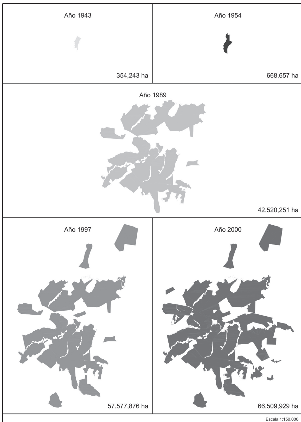
Figura 2 EXPANSIÓN URBANA DE CALDAS NOVAS, 1943-2000