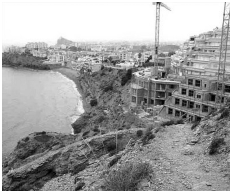
Figura 4 VIVIENDAS EN CONSTRUCCIÓN EN EL ACANTILADO DE LA PLAYA DE EL HORNILLO. OCTUBRE DE 2008.

De los municipios del litoral murciano, el de Águilas ha sido el que menos ha desarrollado la actividad turística, debido a que ha centrado su economía en la agricultura y la pesca. No por ello ha quedado al margen del proceso turístico urbanizador que ha afectado al Arco Mediterráneo durante la primera década de este siglo, y que se refleja en la cantidad de viviendas construidas, preferentemente destinadas a segunda residencia (Figura 4).