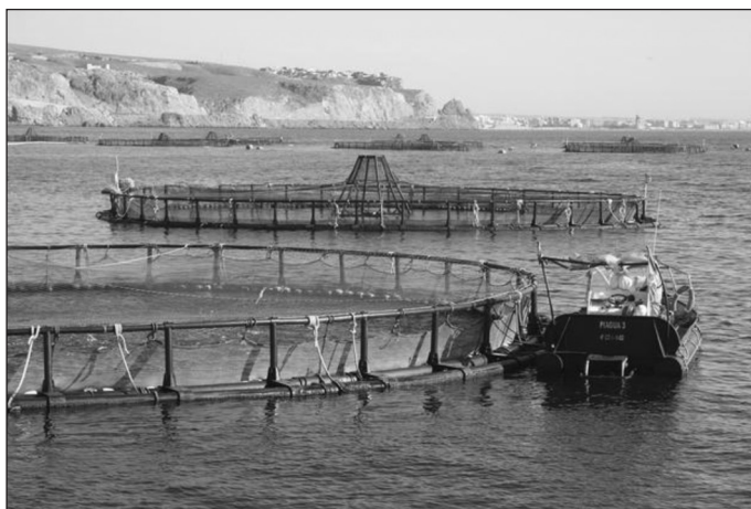
Figura 3 PISCIFACTORÍA PARA EL CULTIVO DE DORADA Y LUBINA. PUNTA PARDA. ÁGUILAS. AÑO 2010