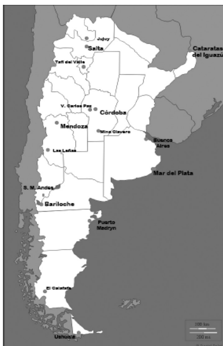
Figura 1 DESTINOS CONSIDERADOS 1ª Y 2ª INSTANCIA – INVIERNO 2009

Se realizaron estudios de campo durante los meses de abril (primera instancia) y de junio (segunda instancia). Los resultados del primer estudio incluyen los siguientes DT: Bariloche, Mendoza, Cataratas del Iguazú, Córdoba, El Calafate, Ushuaia, Salta, Buenos Aires, Puerto Madryn, San Martín de los Andes, Jujuy, Las Leñas, Mar del Plata, Tañá del Valle y Villa Carlos Paz. En el segundo además de estos destinos se consideró Mina Clavero. La ubicación geográfica de los mismos puede observarse en la Figura 1.