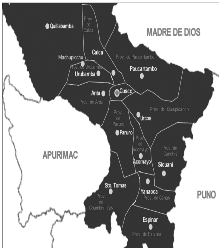
Mapa 2 MAPA REGIÓN DE CUZCO