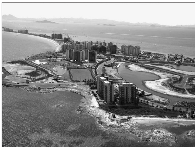
Figura 3 VENEZIOLA EN LA ZONA NORTE DE LA MANGA DEL MAR MENOR