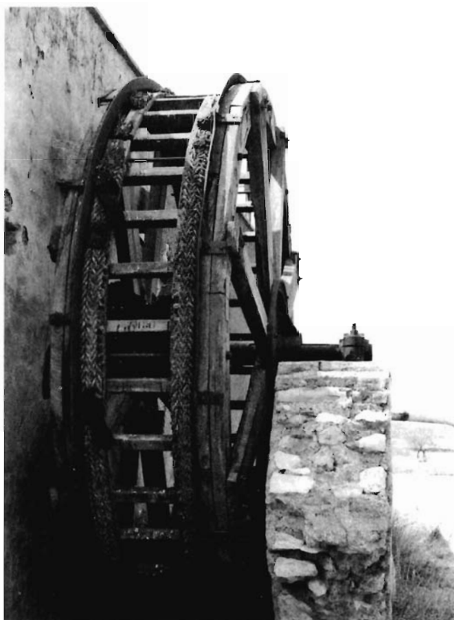
Fig. 2: Detalle de la rueda adosada a la espalda del molino, en ella se aprecia aún la cuerda de esparto o maroma.

rior reconstrucción, pero hay que destacar que queda una parte mínima de lo que existió 4 y que, junto con las aceñas, permitieron la transformación del paisaje cartagenero y la mejora del nivel de vida de sus habitantes (Fig. 2).