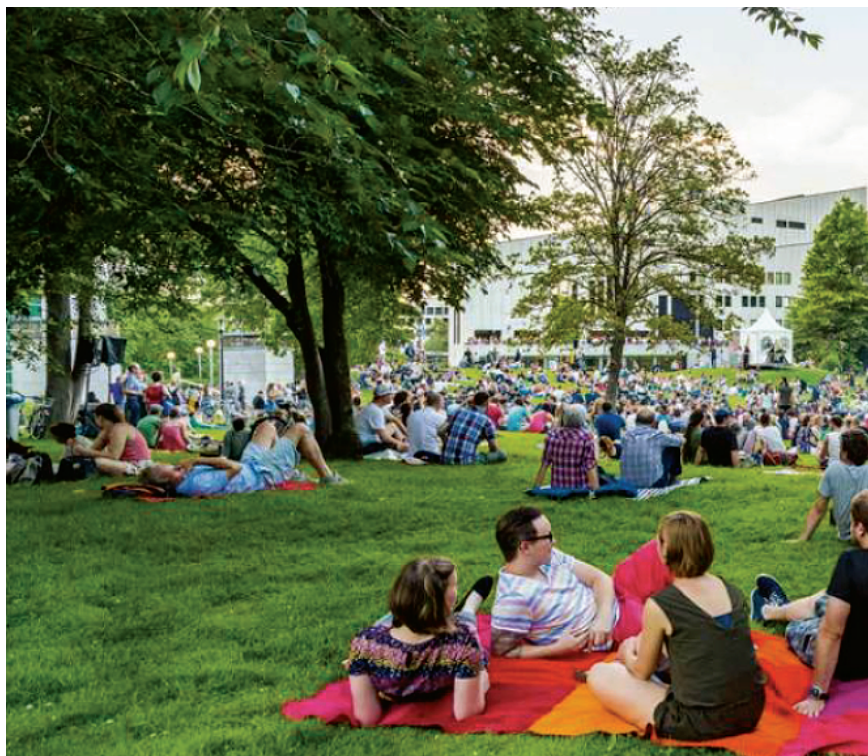
Figura 5. Imagen de espacios verdes en Essen en la publicación «Essen: Capital Verde Europea» (Unión Europea, 2017: 28).

modo, la publicación muestra la vida en la región, que permite un alto valor recreativo principalmente a través de los espacios de esparcimiento, por ejemplo para hacer picnics y montar en bicicleta en «el» campo, lo que complementa una economía próspera (Fig. 5); sin embargo, sin nombrarlo ni representarlo más concretamente. Las imágenes a lo largo de la publicación se limitan predominantemente a escenas de ocio, y solo la Universidad y las «ecoinnovaciones» (Unión Europea, 2017: 33) se nombran como posibles lugares de trabajo. De un total de 45 imágenes, sólo dos representan posibles lugares de trabajo. 5