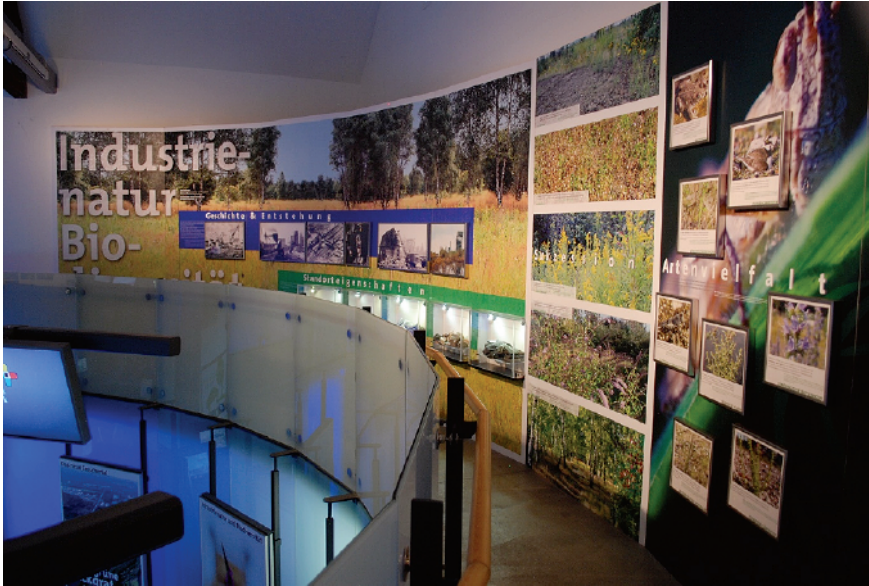
Figura 4. Exposición sobre la naturaleza industrial en la región del Ruhr en la Casa Ripshorst en Oberhausen, región del Ruhr.