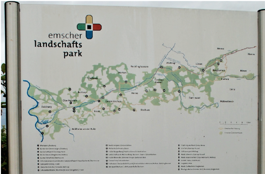
Figura 1. Cartel en el parque paisajístico del río Emscher, en la región del Ruhr, que marca las rutas ciclistas y los lugares importantes.

la exención de las aguas residuales se completó con éxito, como anunció la Emschergenossenschaft, la cooperativa Emscher, en enero de 2022 (Emschergenossenschaft-Lippeverband 2022). Desde 1991, ha sido el actor central de estas medidas de rediseño, que dieron gran valor a la documentación fotográfica de dichas medidas durante los últimos años (Emschergenossenschaft-Lippeverband o.J.). Así, tanto «la gente en el nuevo valle de Emscher» como «la vida en el nuevo valle de Emscher» fueron retratados fotográficamente en los cursos del Centro de Educación de Adultos y en los proyectos relacionados con ellos, y los resultados de estos proyectos fotográficos se expusieron en diversos lugares de la región (Fig. 2) (Emscherfotografen o.J.).