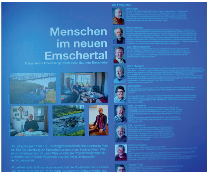
Figura 2. Texto de la exposición sobre los proyectos fotográficos con la participación de la cooperativa Emscher en la Casa Ripshorst en Oberhausen.

región del Ruhr fuera inspeccionada debido a las condiciones espaciales, por lo que este diseño espacial produjo una imagen visualmente perceptible de la nueva región del Ruhr por primera vez a través de los puntos de referencia (Ibid.: 79).