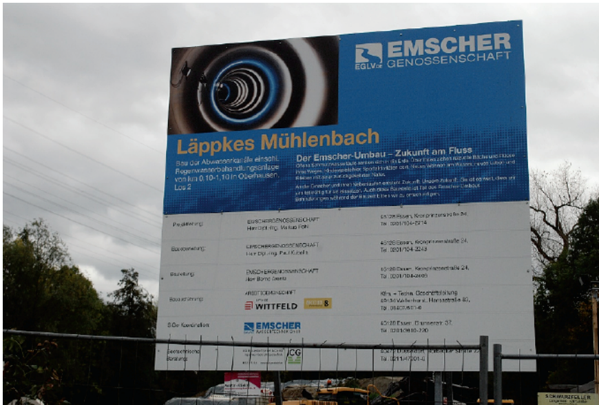
Figura 3. Cartel de obra durante la reconstrucción de las alcantarillas en el río Emscher.

intento de establecer un nuevo concepto de naturaleza en la región: la naturaleza industrial.