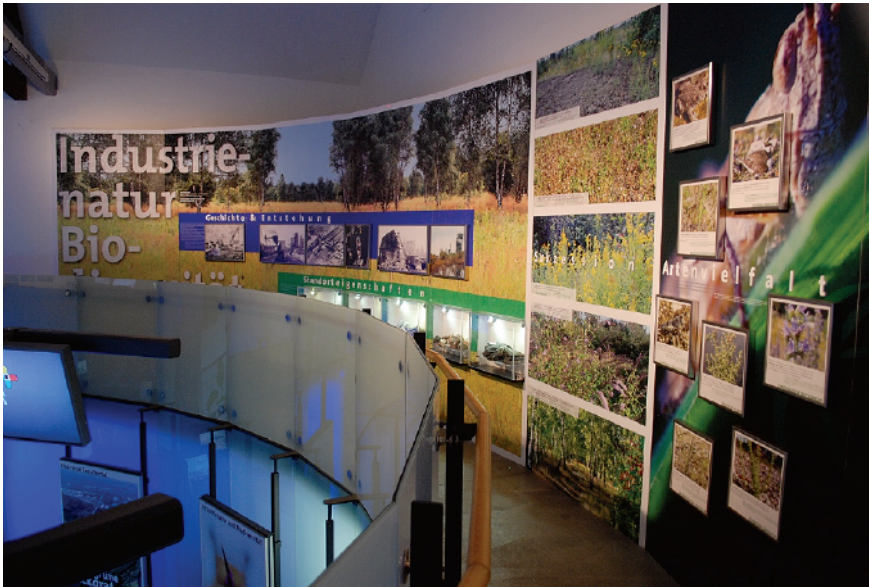
Abbildung 4. Ausstellung zur Industrienatur im Ruhrgebiet im Ripshorst-Haus in Oberhausen, Ruhrgebiet.