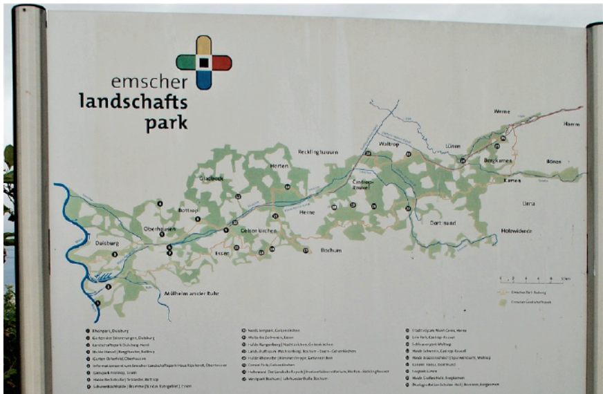
Abbildung 1. Schild im Flusslandschaftspark Emscher im Ruhrgebiet, das Radwege und wichtige Orte markiert.

Verbraucherschutz des Landes Nordrhein-Westfalen o.J.). Ende 2021 ist die Abwasserbefeuerung erfolgreich abgeschlossen worden, wie die Emschergenossenschaft im Januar 2022 mitteilte (Emschergenossenschaft & Lippeverband, 2022). Sie ist seit 1991 der zentrale Akteur dieser Umgestaltungsmaßnahmen, die auf eine fotografische Dokumentation der genannten Maßnahmen während der vergangenen Jahre großen Wert legte (Emschergenossenschaft & Lippeverband o.J.). So wurden in Kursen der Volkshochschule und daran geknüpften Projekten sowohl „Menschen im Neuen Emschertal“ als auch das „Leben im Neuen Emschertal“ fotografisch porträtiert und die Ergebnisse dieser Fotoprojekte an verschiedenen Standorten der Region ausgestellt (siehe Abb. 2) (vgl. Emscherfotografen o.J.).