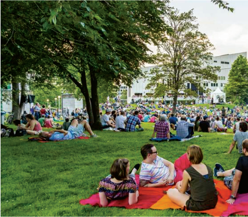
Abbildung 5. Bild der Grünflächen in Essen in der Publikation „Essen: European Green Capital“ (Europäische Union, 2017: 28).

Naturlandschaften gezeigt wurden, die die Menschen auf den Bildern als Freizeitraum nutzen. Die Publikation zeigt auf diese Weise das Leben in der Region, die vor allem durch Erholungsräume zum Beispiel für Picknicks und Radfahrten in „der“ Natur einen hohen Freizeitwert ermöglicht, die eine prosperierende Wirtschaft ergänzt; ohne dass diese jedoch konkreter benannt oder abgebildet wird. Die Bilder der gesamten Publikation beschränken sich überwiegend auf Szenen der Freizeit, lediglich die Universität und „Öko-Innovationen“ (Europäische Union, 2017: 33) werden als potentielle Arbeitsstätten benannt. Von den insgesamt 45 Bildern repräsentieren nur zwei mögliche Arbeitsplätze. 5