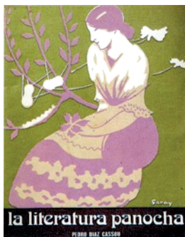
Portada de La literatura panocha de Pedro Díaz Cassou.

Dada la importancia que tal obra tiene en el sistema de riego de la huerta de Murcia, se ha seleccionado el siguiente fragmento, aunque, evidentemente, se trata de una leyenda, debida a la magnífica pluma de Pedro Díaz Cassou. 27