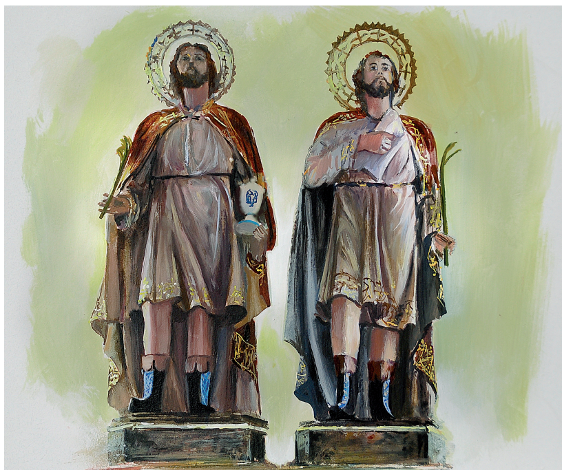
San Cosme y San Damián, patronos de la ermita. Pintura de Pedro Diego Pérez Casanova.