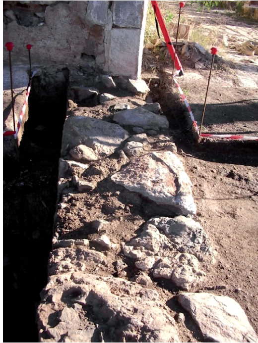
Fig. 7. Arranque de la continuación del muro en la esquina sureste, prospecciones de 2008.

Gracias a los trabajos efectuados en la primera mitad del 2008, como parte prescriptiva del proyecto de ejecución, hoy poseemos un conjunto de datos que ayudan a sustentar las decisiones de diseño referidas a la distribución y relaciones espaciales que articulan una recuperación fiel, coherente, con la evolución constructiva del conjunto y su memoria histórica.