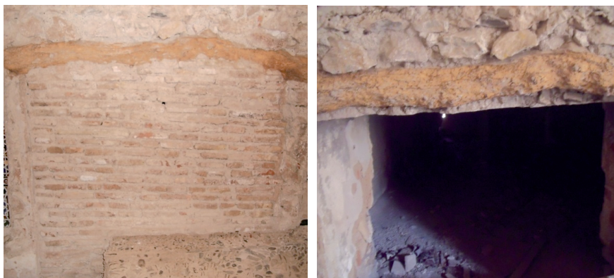
Figs. 8-9. Confirmación de acceso al claustro por el muro interior del ala Este.

cios (aperturas de puertas, recorridos). Especialmente en la significación de la entrada al recinto monástico por el alzado Este junto a la sacristía, y desde allí al claustro.