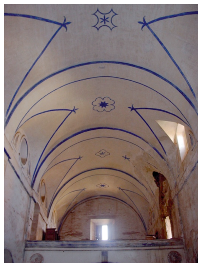
Fig. 4. Bóvedas de la iglesia, con fajones y lunetos, restauradas en 1876.

La amortización de la panda Oeste del Claustro, de paramentos de adobe y ladrillo, se debió producir probablemente dentro del siglo XVII, y se podría apuntar como causa el asalto berberisco de 1670. 2