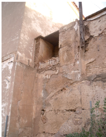
Fig. 3. Muro del Alzado Oeste del Claustro y encuentro con la fábrica de la iglesia.