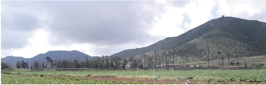
Fig. 1: Vista del monasterio de San Ginés de la Jara y el monte Miral desde el Norte.

La presencia de determinados edificios tiene algo secreto, sin ellos es casi imposible imaginarse el lugar donde se erigen. Dan la impresión de ser una parte natural de su entorno y parecen decir: «Soy como tú me ves, y pertenezco a este lugar»