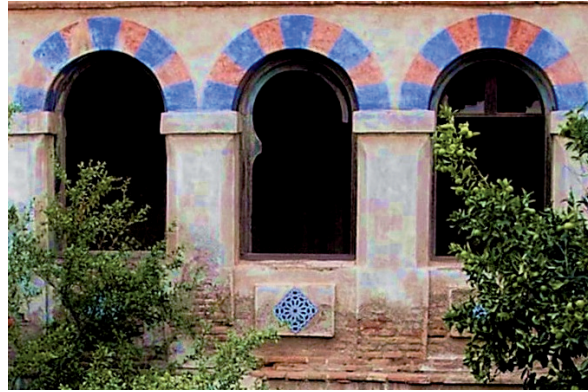
Fig. 2. Cuerpo superior del claustro con las transformaciones temáticas de 1934.

(y de probable reaprovechamiento) de la portada renacentista de mampostería de sillares.