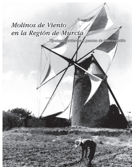
Figura 3. I. García Simó y M. A. Redondo López: Molinos de Viento en la Región de Murcia (2008).