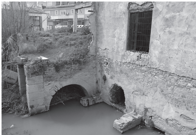
Figura 6. Arcos del Molino Grande de Puebla de Soto, sobre la acequia de Barreras, aguas abajo, un lugar conocido como El Remanso.