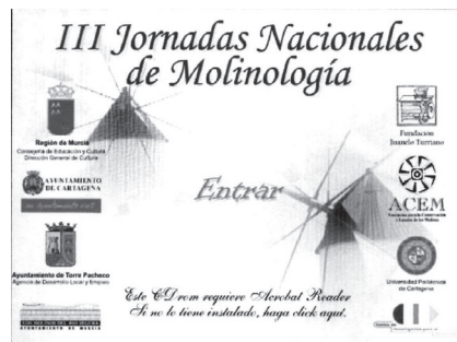
Figura 4. III Jornadas Nacionales de Molinología, Cartagena, 2001.