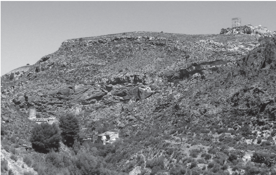
Figura 2. Rambla de los Molinos de Aledo, al pie de la villa.