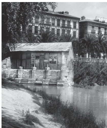
Figura 7. Molino de Roque, sucesor del molino de San Francisco (Fotografía: Murcia. Miradas y recuerdos, Tivoli, Valencia, 2007, p. 111).