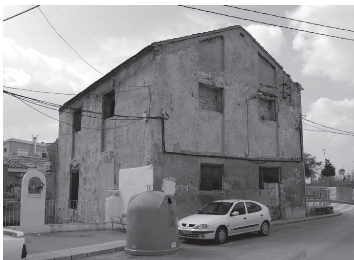
Figura 5. Molino de Abades, del Obispo o Molino Grande de Puebla de Soto.