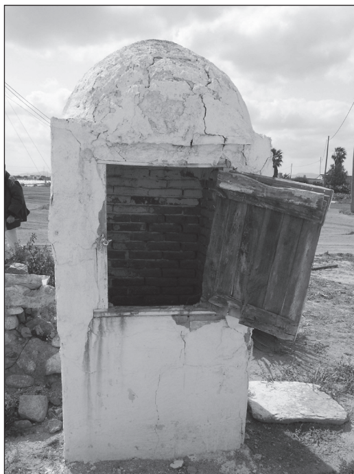
FOTO 9. Aljibe de agua fresca. Vista general.