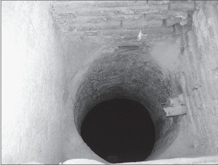
FOTO 7. Aljibe de agua fresca. Acceso al agua.