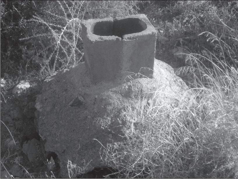
FOTO 3. Las lumbreras son los respiraderos de la fogaras.