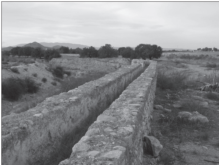
FOTO 11. Canalización del riego viejo de Fuente Álamo.