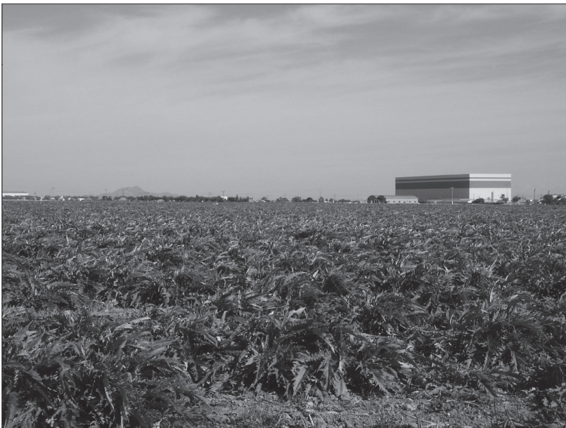
FOTO 2. Los campos de alcachofas y la horticultura, con la nueva iniciativa empresarial sustituyeron los campos de cereal.