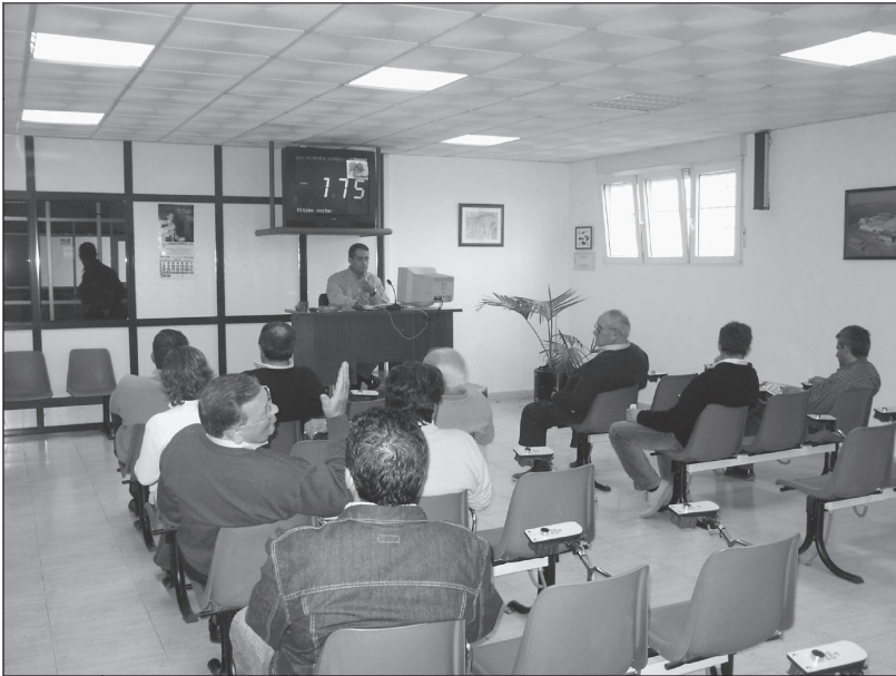
FOTO 1. Las corridas son el efecto empresarial de una nueva agricultura.