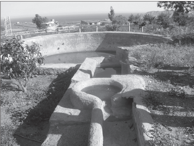
FOTO 4. Sistema hidráulico domestico de P. Morata en El Garrobilllo.