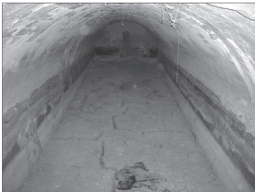
FOTO 12. Interior de un aljibe de bóveda de cañón.