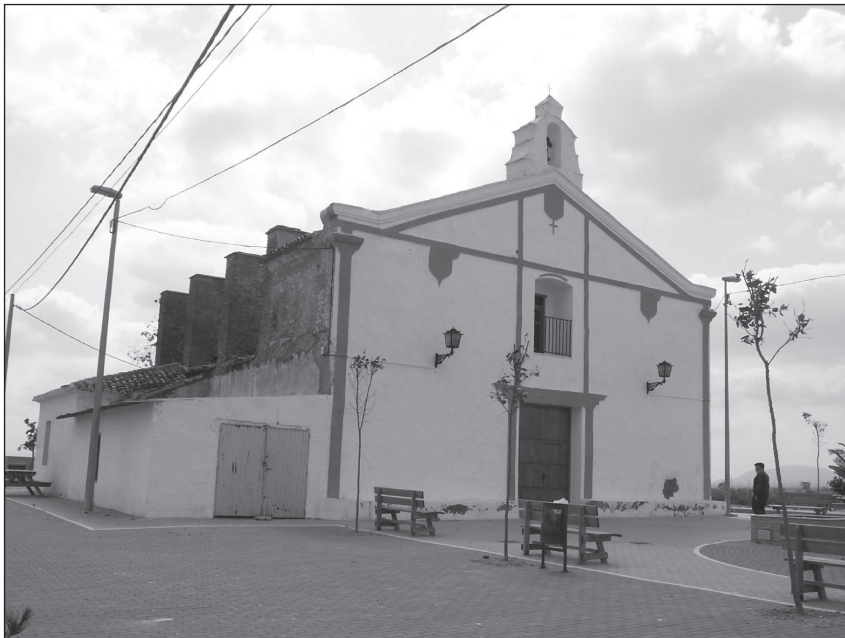
FOTO 6. Subastas de agua en la ermita de los Ríos.