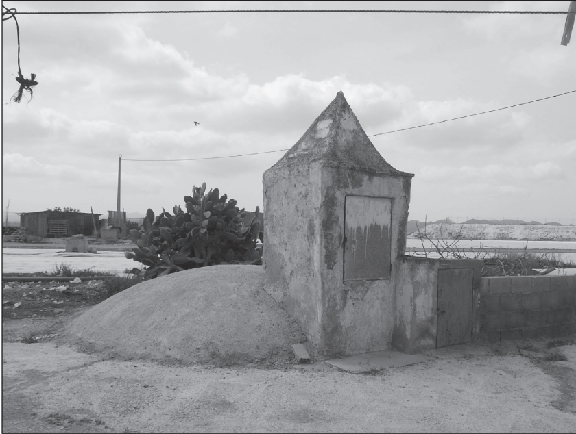
FOTO 5. Aljibe de los Ríos.