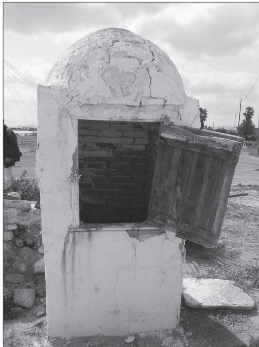
FOTO 8. Aljibe de agua fresca. Acceso exterior.