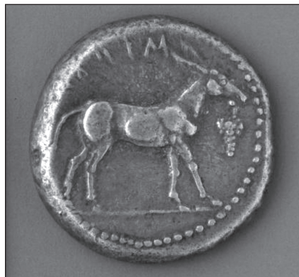
FIGURA 3. Moneda griega que muestra a un asno frente a un racimo de uvas que cuelga de su boca.