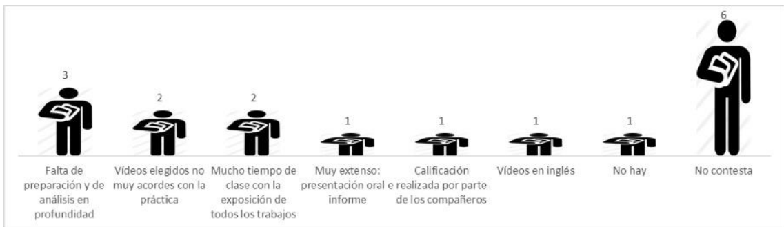
Figura 3. Respuestas recibidas y número acerca de los puntos negativos de la realización de la práctica

En cuanto a los puntos negativos, el 18% del alumnado dejó la pregunta en blanco. Las respuestas estuvieron relacionadas con la falta de preparación o de interés por parte de ciertos grupos en la realización de la práctica, y por la elección de videoclips cuya información era escasa para relacionarla con conceptos vistos en las clases teóricas. Asimismo, algunos estudiantes consideraron que la actividad era muy extensa, tanto por el tiempo invertido en las clases, como por la realización de la práctica en sí (búsqueda de videoclip, análisis y presentación oral y escrita) (Figura 3).