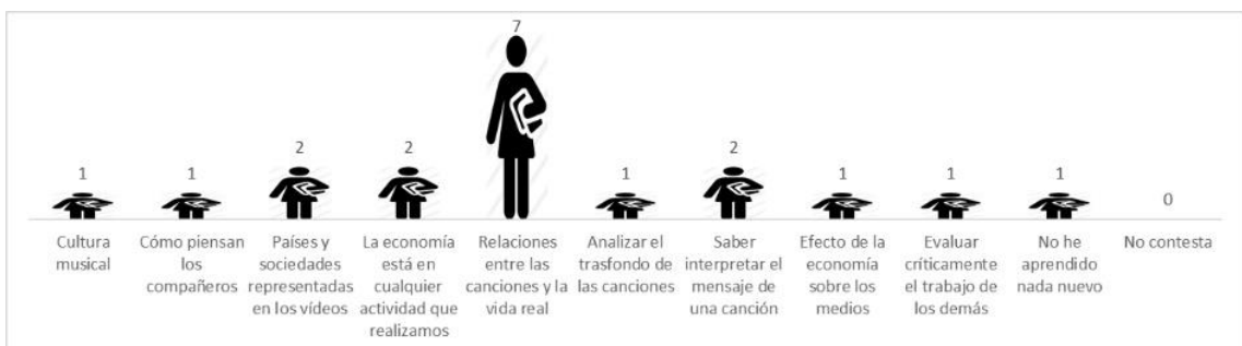
Figura 4. Respuestas recibidas y número acerca del aprendizaje

Cuando se les preguntó qué habían aprendido con la realización de la práctica, la mayoría del alumnado respondió cuestiones que relacionaban las temáticas de las canciones con problemáticas cotidianas de la sociedad. También consideraron que habían aprendido a interpretar de manera más adecuada el mensaje y el trasfondo de una canción, conocer cómo piensan otros compañeros respecto a diferentes temas y a evaluar críticamente el trabajo de terceros. Un único estudiante consideró también que la actividad no le había aportado nada nuevo (Figura 4).