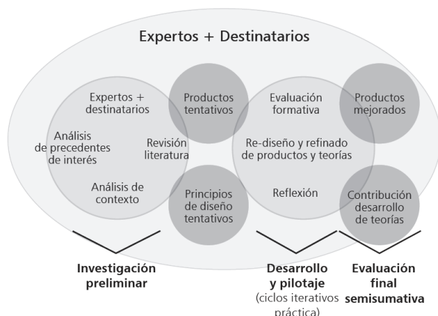
Figura 1. Modelo genérico de investigación basada en el diseño.

La metodología de investigación escogida se basa en una secuenciación o fases que nos ayudan a estructurar todo el proceso (Plomp, 2013): investigación preliminar, desarrollo y pilotaje y evaluación final (Figura 1). En la primera fase, de investigación preliminar, se realiza un análisis de las necesidades, descripción del problema y revisión de la literatura especializada. De esta fase destaca la colaboración de expertos y destinatarios en el análisis de necesidades, estudio y definición del problema. La fase de desarrollo y pilotaje se estructura en diferentes ciclos interactivos de aplicación y evaluación buscando la mejora progresiva del producto. Es cuando se producen estos nuevos productos mejorados cuando se contribuye a la creación de principios de diseño y a la fundamentación de teorías. Finalmente, en la última etapa, se valora hasta qué punto los productos finales cumplen la finalidad de la investigación.