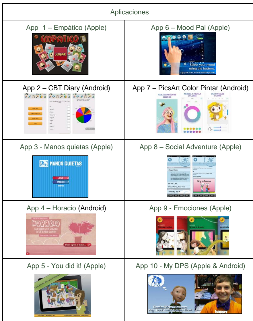
Tabla 2. Muestra: Aplicaciones seleccionadas para su análisis

A la luz del proceso seguido se seleccionaron diez apps de contenido emocional para niños entre 2 y 8 años, que se presentan en la tabla 2.