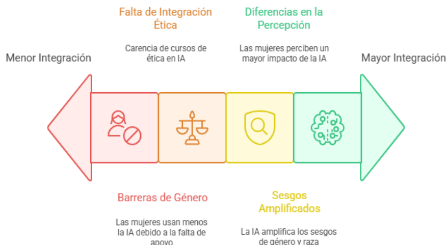
Figura 4 Desafíos en la Integración de la IA y la igualdad de género

Para avanzar a la práctica, se proponen: alfabetización en AIEd con enfoque de igualdad (Gago-Galvagno et al., 2025), acceso equitativo a intervenciones basadas en IA (Eteng-Uket et al. 2025), y diseño/evaluación con estrategias sensibles al género (Chang et al., 2025); además, políticas universitarias con perspectiva de género sobre uso ético (Pérez-Portabella et al., 2025), exposición amplia a GenAI para asegurar igualdad (Sun & Zhou, 2025), auditorías de equidad grupal en modelos de IA (Li et al., 2025) e inclusión curricular del uso ético y responsable (Bower et al., 2024).