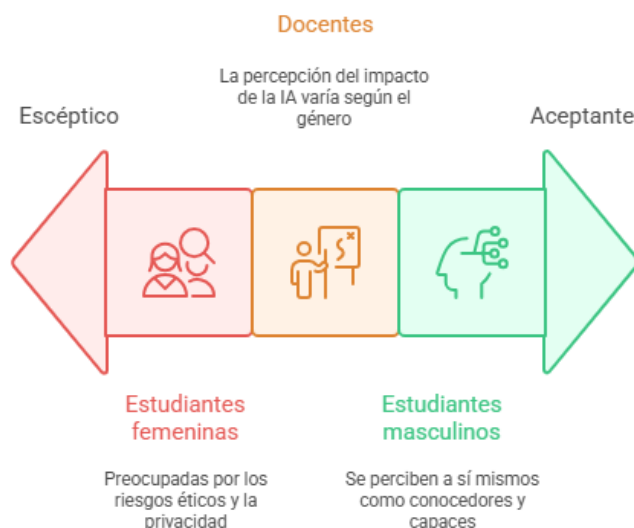
Figura 3 Percepciones sobre la IA basadas en el género

Frente a esto, a pesar de que los hombres son significativamente más conscientes del uso potencial de datos personales por parte de la IA, también están considerablemente más dispuestos a permitir que la IA utilice sus datos personales para ejecutar tareas, lo que confirma lo dicho por Cachero et al. (2025) acerca de que los hombres son significativamente más optimistas sobre el potencial impacto positivo de la IA en la sociedad. De este modo, las percepciones sobre la inteligencia artificial entre docentes y estudiantes de educación superior muestran diferencias claras según el género que van desde el escepticismo a la aceptación (Figura 3).