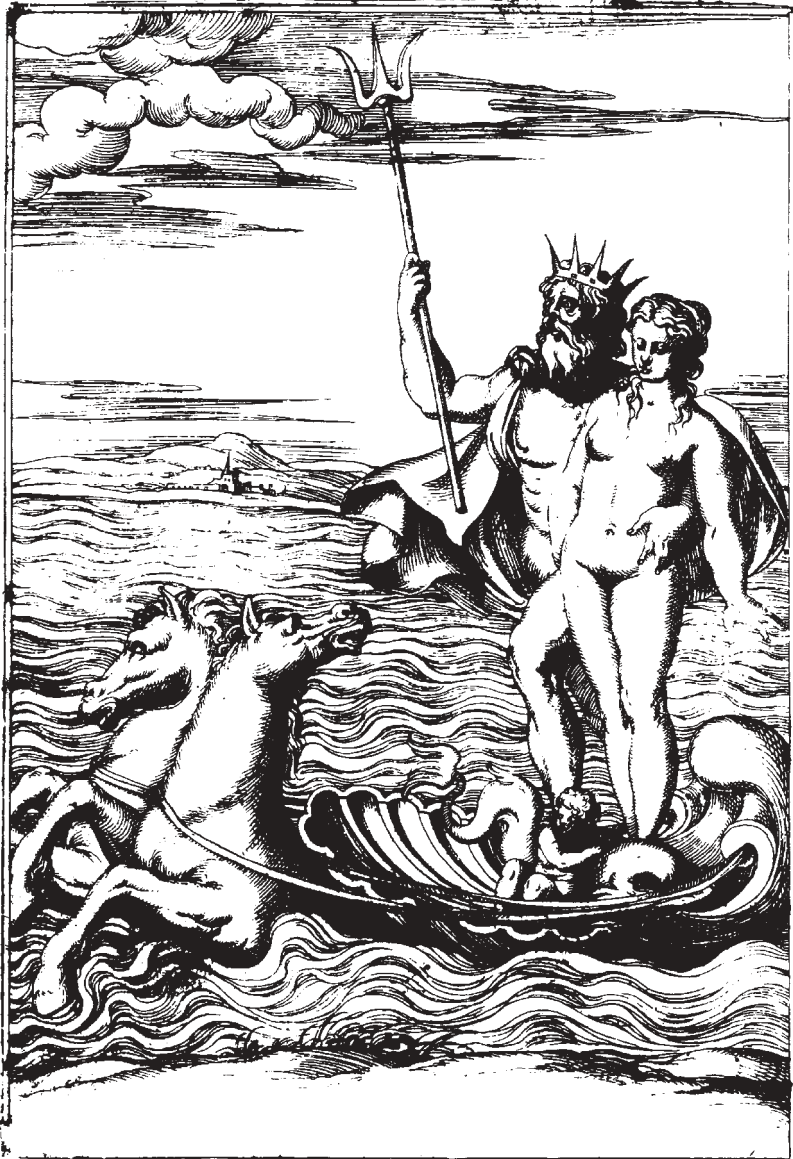
Figura 6. Neptuno y Anfitrite. Grabado del libro de Vincenzo Cartari: Le imagini de i dei de gli antichi , Venecia, 1571.