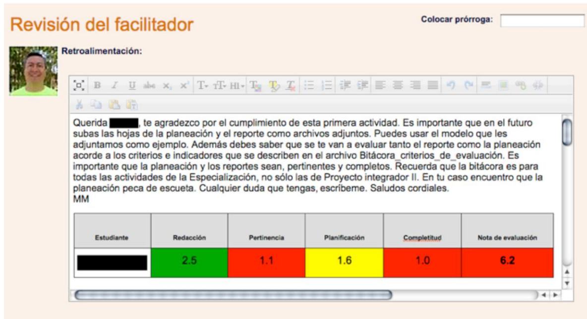
Figura 1. Ejemplo de retroalimentación a la bitácora correspondiente a la semana 1.

Se observó que los estudiantes que se adaptaron rápidamente a los requerimientos de la bitácora (3 de 19) tuvieron una mayor ventaja académica sobre aquellos que mostraron resistencia para hacerla (7 de 19); estos últimos, en sus propias palabras, se resistían porque consideraban que la bitácora sólo era "una carta de buenas intenciones".