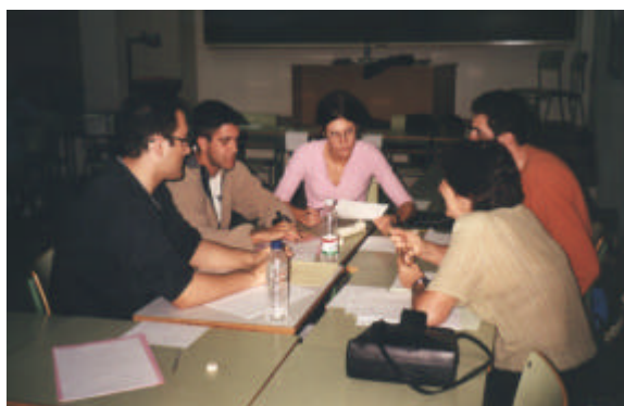
Fig. 1. Diferents moments de coordinació de treball amb els alumnes i professors.