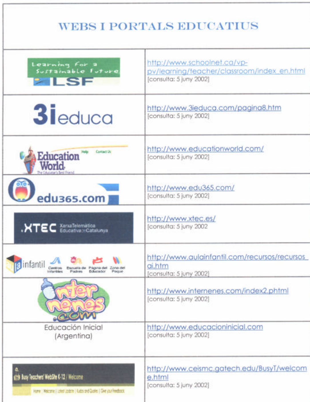
Fig. 5. Exemplificació sobre un índex parcial dels comentaris de pàgines web