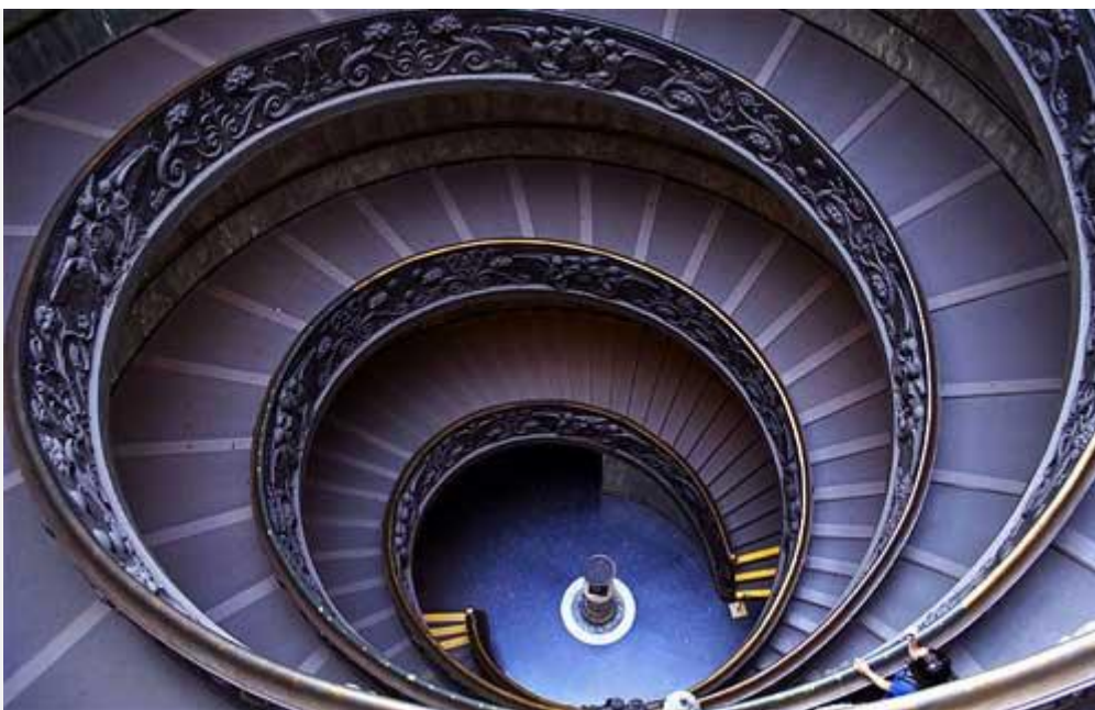
Fig. 3 La escalera de Bramante es un claro ejemplo de iteración en el diseño arquitectónico.

Son particularmente importantes las aportaciones en este sentido de Mack (2001); Olive & Vomvoridi (2006). E igualmente las de Steffe & Olive (2010) para el desdoblamiento de operaciones, que juega un papel crítico en la construcción de esquemas de fracciones por los estudiantes, tales como el esquema de fracción iterativo. Otras investigaciones en este sentido fueron las de Hackenberg, (2007) y Steffe (2004).