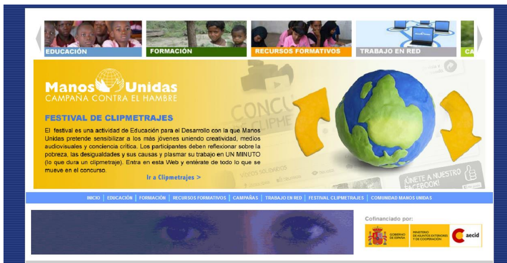
Ilustración 5: http://www.manosunidas-online.org/