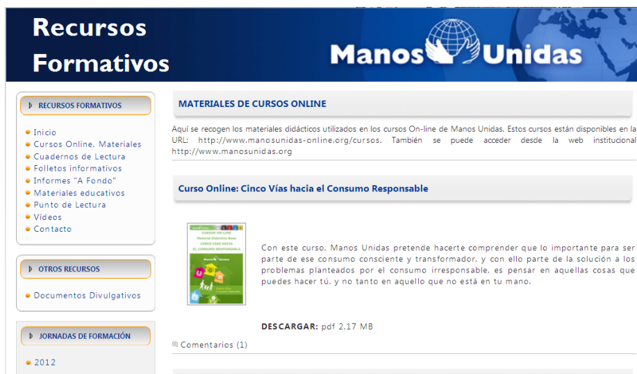
Ilustración 4: Cursos online