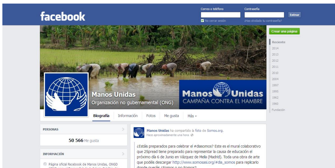
Ilustración 6: Manos Unidas en las redes sociales

Por último, señalar que de los 14 indicadores incluidos en la matriz de evaluación a modo de hipótesis, el análisis factorial ha demostrado que se pueden reducir a 12: (1) pertinencia, (2) eficacia-eficiencia, (3) aspectos metodológicos y contenidos, (4) participación, (5) nuevas tecnologías, (6) viabilidad-sostenibilidad, (7) cobertura, (8) coherencia, (9) visibilidad, (10) coordinación-trabajo en red, (11) apropiación y (12) calidad pedagógica.