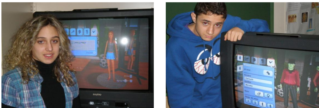
Fig. nº 3. Asumir diferentes identidades

Tras varias sesiones de juego en el aula con Los Sims 3 y la narración de sus acontecimientos en la red social, la profesora les lanza un reto final, deben escribir la autobiografía de sus personajes. Han adquirido un dominio del juego que les permite ir más allá y situarse en un mundo de ficción, en el contexto generado después de haber jugado. Podemos decir que el instrumento, el videojuego, y el medio donde llevan a cabo a la autobiografía, la red social, permiten desarrollar un proceso creativo que no les limita y donde la clave es el lenguaje escrito.