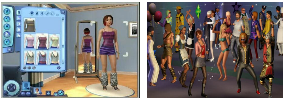
Fig. nº 1.- Diferentes posibilidades en el mundo de Los Sims 3.

Exploraremos ahora la relación entre el jugador y los personajes en el mundo virtual, a través de las conversaciones en clase o en la red. Presentaremos este tema desde las posibilidades que el mundo del videojuego Los Sims 3 http://es.thesims3.com/ ofrece y cómo nos lo han contado los alumnos a través de la red social Jugar y Aprender http://uah-gipi.org/red/ . Al enfrentarnos al mundo del videojuego surge el primer aspecto a tener en cuenta y uno de los más importantes, cómo situarnos dentro del propio juego.