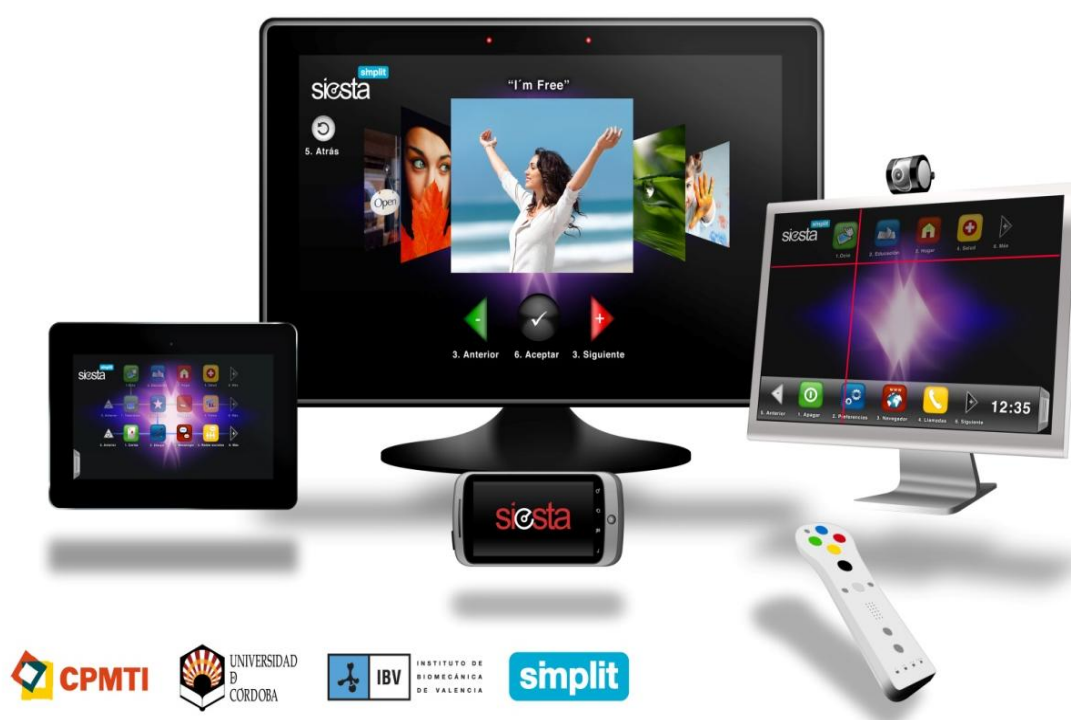
Fig.2. Componentes del Kit iFreeSIN

El objetivo de iFreeSIN es que cualquier aplicación pueda ser accesible a cualquier tipo de persona con discapacidad, sin tener que desarrollar aplicaciones especiales ni utilizar dispositivos adaptado a este tipo de personas. Para ello tenemos que hacer que los sistemas operativos, las plataformas web y las aplicaciones en general puedan ser accesibles y usables, el sistema operativo basado en GNU/Linux y la plataforma Web Siesta en la nube son los únicos sistemas totalmente accesibles y usables (con sello SIMPLIT).