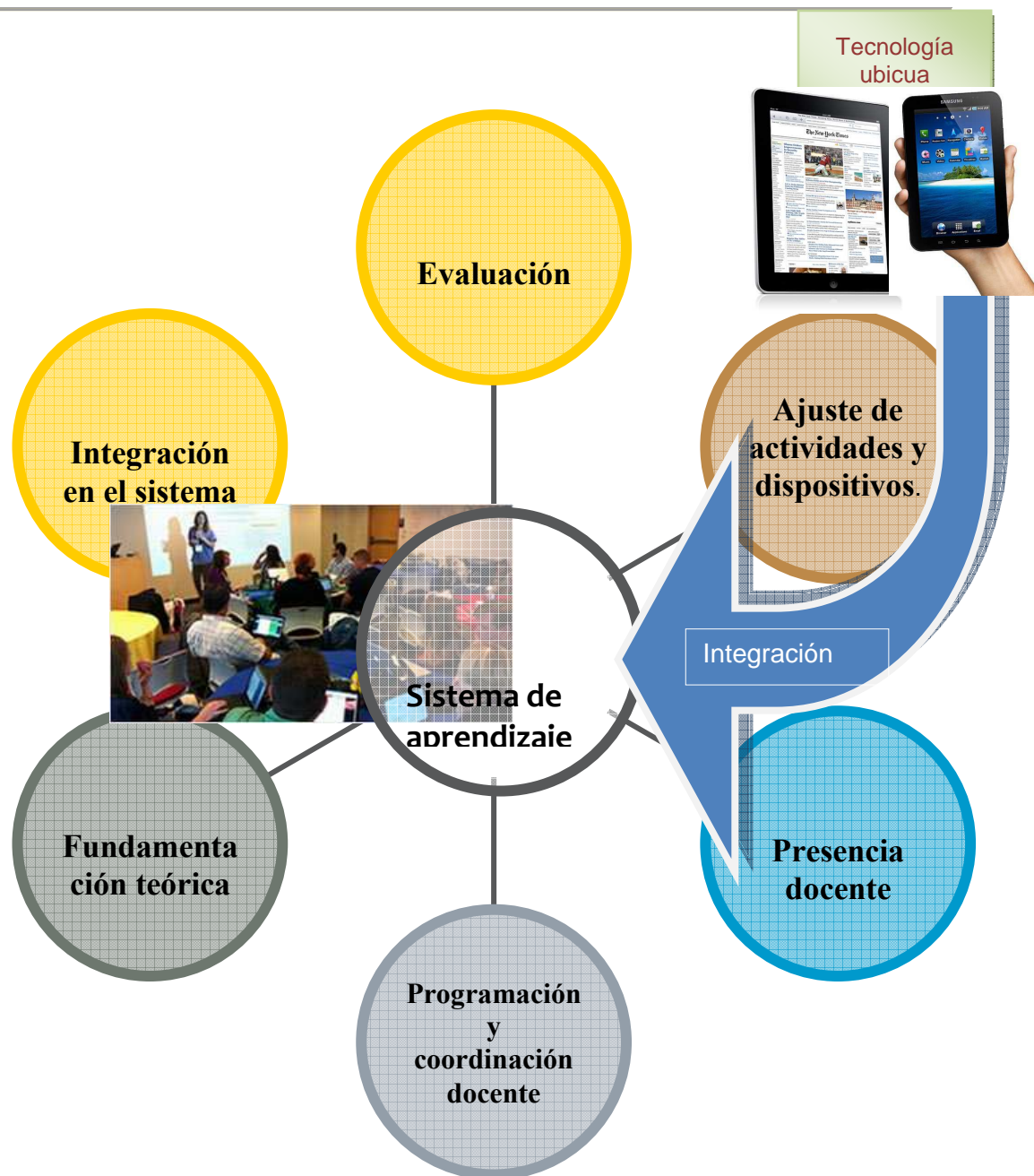
Fig. 1.- Elementos de evaluación de la calidad en entornos ubicuos de aprendizaje