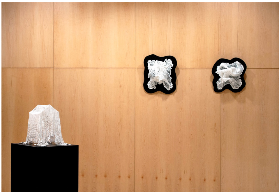
Figura 2. Vista en sala de La posesión y la serie El colapso de la psique .