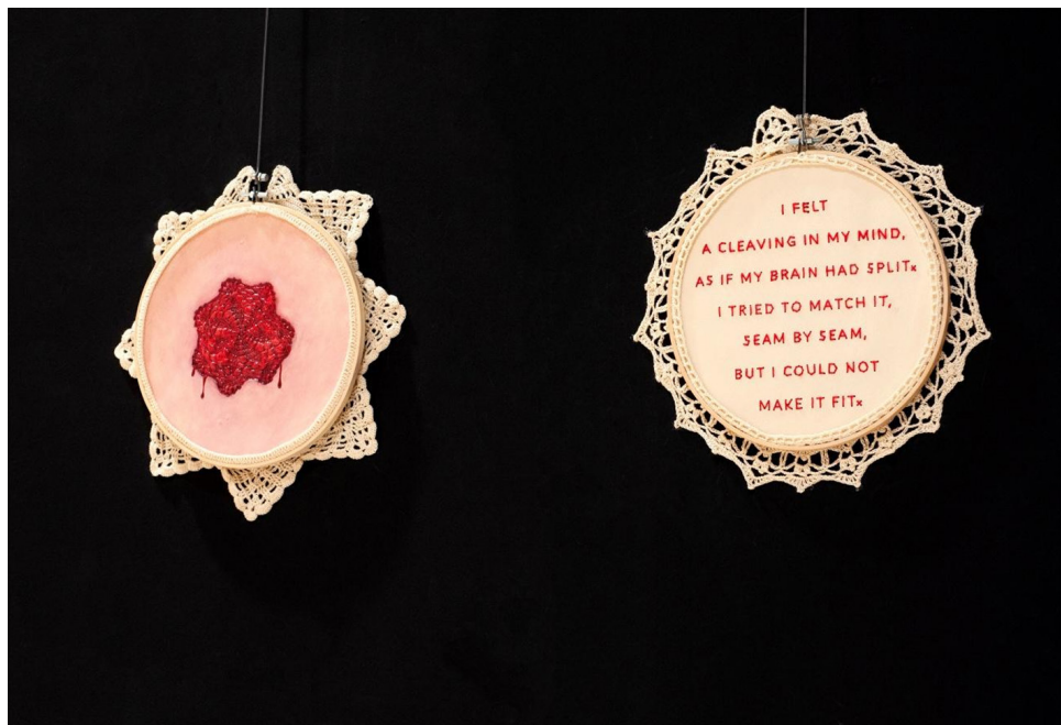
Figura 9. A la izquierda, La herida , 2025. Cerámica, pintura y ganchillo. A la derecha, La división , 2025. Cerámica, hilo y ganchillo.

La obra plástica de esta exposición entrelaza una amplia variedad de técnicas y medios, entre las que destacan el empleo de tela e hilo combinados con otros materiales, el dibujo con técnicas tradicionales y la cerámica intervenida, creando así piezas cargadas de simbolismo que exploran la fragilidad, el trauma y las emociones subyacentes a la experiencia femenina. Estas técnicas y materiales, en su unión, me han permitido generar composiciones visuales que transitan entre lo tangible y lo conceptual, evocando sensaciones de vulnerabilidad y potencia al mismo tiempo. Así pues, en este proyecto, indago en la locura femenina, entendida como los conflictos psicológicos y emocionales que se entrelazan con la experiencia vital de las mujeres, utilizando los espacios cotidianos del hogar para explorar temas como el daño psicológico, la opresión y el desmoronamiento de la psique. Por lo tanto, queda plasmada en esta muestra expositiva la investigación sobre el concepto de identidad femenina y como esta se ve afectada por los conflictos psíquicos inherentes a la vivencia de la mujer.