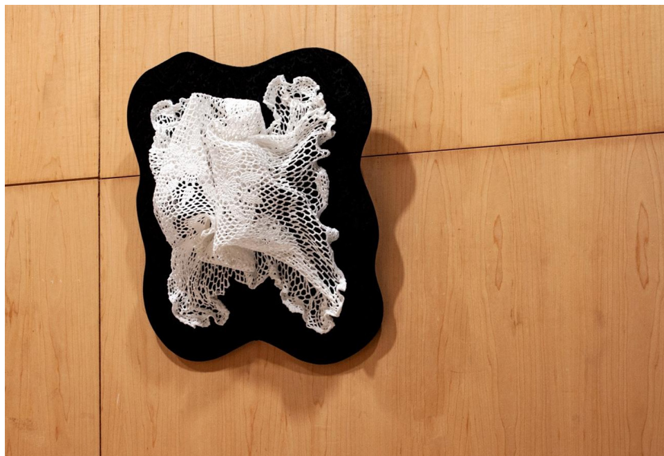
Figura 4. El colapso de la psique , 2025. Porcelana y tela sobre tabla.