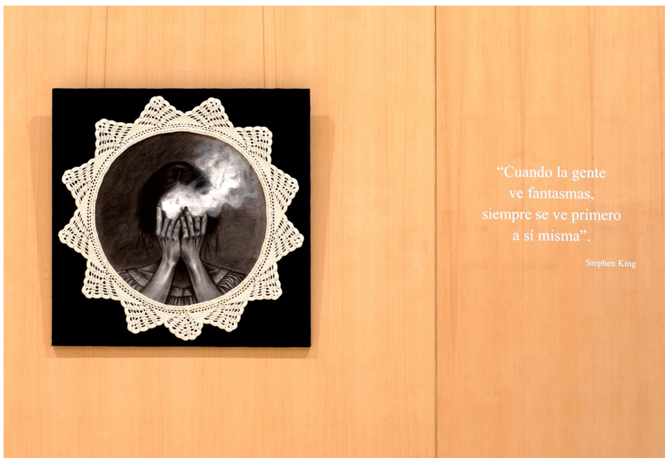
Figura 10. El lamento de las llamas , 2025. Dibujo, ganchillo y tela sobre tabla. Texto: cita de Stephen King.