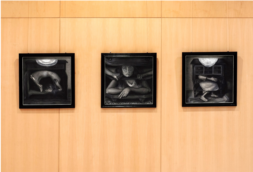
Figura 6. Serie Jaula doméstica , 2025. Lápiz Conté sobre papel.