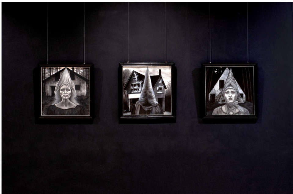
Figura 5. Serie Psicóticas , 2025. Lápiz Conté sobre papel.