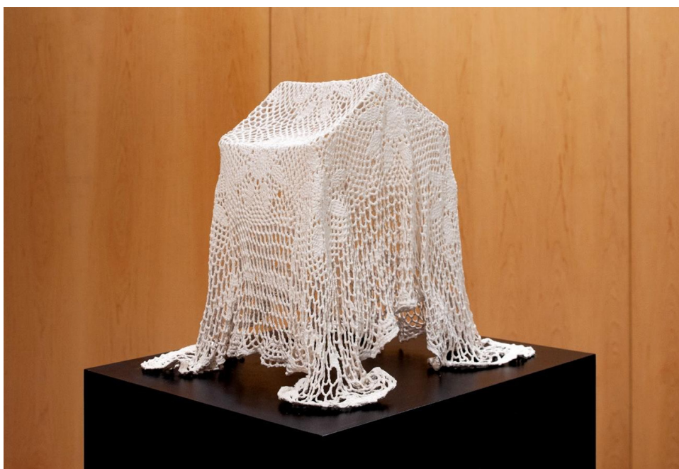
Figura 3. La posesión , 2025. Porcelana.