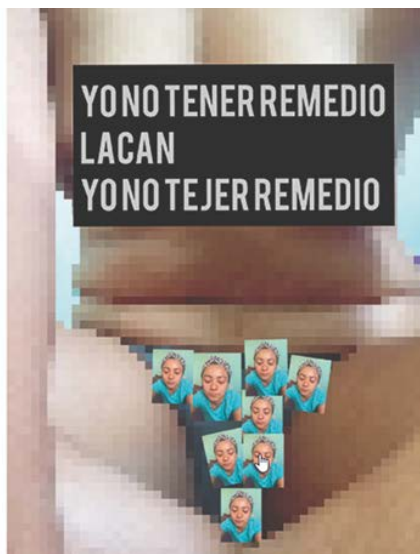
Figura 5. Testimonio de la violencia económica y psicológica.