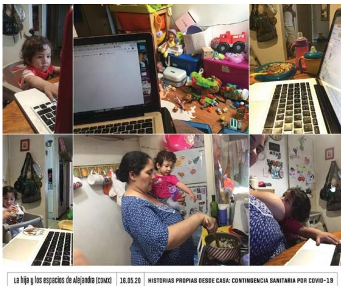
Figura 5. Testimonio del trabajo doméstico no remunerado como ámbito exclusivo de las mujeres. Muchas mujeres fueron madres de tiempo completo, trabajadoras de tiempo completo.