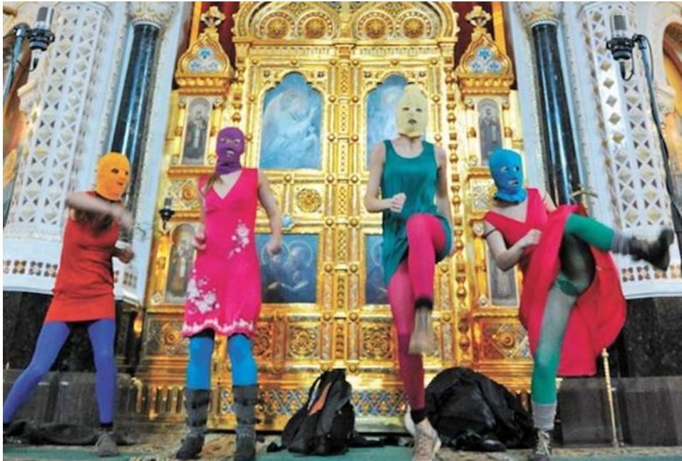
Figura 1. Captura del vídeo de la acción “una plegaria punk” del grupo Pussy Riot en la Catedral del Cristo Salvador. Este vídeo en la actualidad ha sido eliminado por YouTube por “infringir su política sobre incitación al odio” ( https://www.youtube.com/watch?v=GCasuaAczKY )

Empezaremos el recorrido mostrando nuestra primera imagen. Un fotograma de un vídeo difundido en YouTube que bajo el título de “Una plegaria punk” muestra una actuación del grupo de artistas y activistas rusas Pussy Riot.