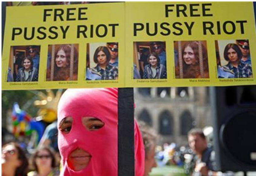
Figura 2. En la imagen, una manifestante participa en una marcha en apoyo de la banda rusa de punk Pussy Riot, en París, el 17 de agosto de 2012. Disponible en: https://www.reuters.com/article/oesen-rusia-pussyriot-veredicto-idESMAE87G05820120817

Tras la detención de los miembros de Pussy Riot que participaron en la performance de la Catedral del Cristo Salvador, hubo protestas en todo el mundo exigiendo su liberación. En muchas de estas concentraciones los manifestantes llevaban balaclavas de colores fabricados de manera casera. De esta forma, el balaclava se constituía como símbolo de resistencia y desafío a la autoridad, así como gesto de solidaridad y empatía hacia el colectivo. Esta multiplicación de fuerzas que vuelven a poner en juego un evento imagen retomando la propuesta inicial y actualizándola en diferentes contextos geográficos fue masiva, extendiéndose los balaclavas de colores en el espacio público por más de cincuenta países.