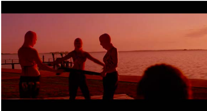
Figura 4. Fotograma de la película Spring Breakers.

Nuestra cuarta imagen nos lleva a otro producto cultural, en este caso de la industria del cine. Se trata de una escena de la película estadounidense Spring Breakers . En esta imagen vemos a las protagonistas llevando un pasamontañas rosa e interpretando una actuación musical en la que bailan al compás de la canción de Britney Spears "Everytime" interpretada por James Franco al piano.