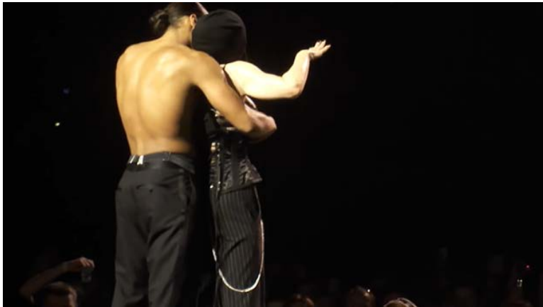
Figura 3. Tres fotogramas de un vídeo grabado durante la actuación de Madonna en Moscú.

En esta puesta en escena encontramos muchos elementos comunes con la performance de las Pussy Riot: una mujer con un pasamontañas tapándole el rostro, y mostrando parte de su cuerpo, protagoniza una actuación musical en un escenario en Moscú. También encontramos muchas diferencias: en esta ocasión no se trata de un grupo, sino de una sola mujer (aunque como vemos en la tercera instantánea en un momento dado es acompañada por un hombre), de nacionalidad americana, vistiendo un atuendo de color exclusivamente negro, y sobre un escenario situado en el estadio olímpico de Moscú.