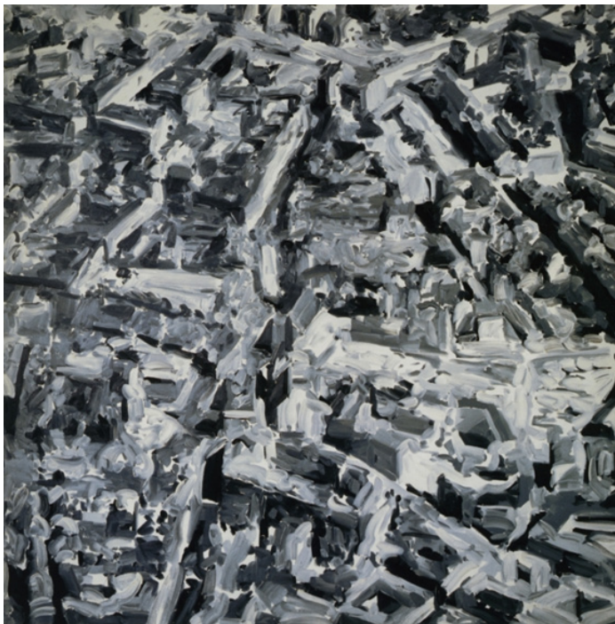
Figura 1. Gerhard Richter. Townscape . 1968. Óleo sobre lienzo. https://www.pinterest.es/pin/370139663115257314/