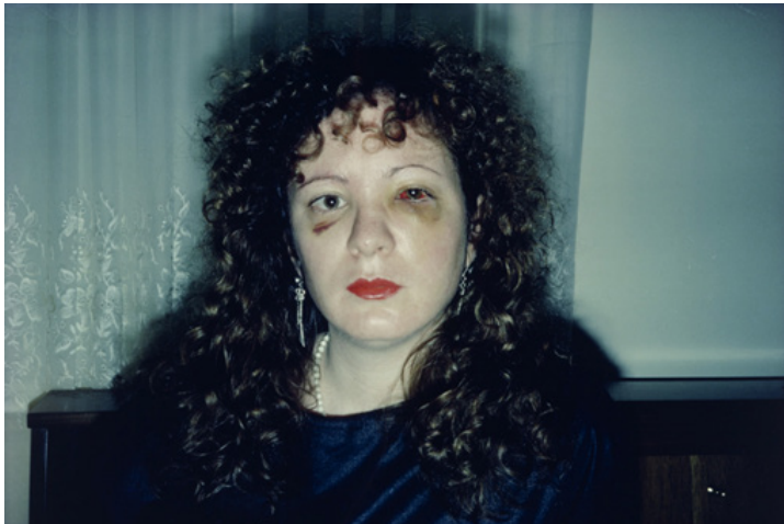
Figura 3. Foto de Nan Goldin, Nan One Month After Being Battered , 1984.

Por otro lado, volviendo a las sesiones de Material sensible , los referentes que se han trabajado en el aula a modo de proyección son artistas que utilizan la cámara como herramienta de diálogo íntimo e identitario, en primera persona, más allá su relación - existente o no - con el ASI. En estas sesiones, se ha contextualizado cada proyecto y a la vez, se ha abierto un espacio para compartir y elaborar los distintos significados, emociones y pensamientos que han emergido de las participantes, alternando momentos de debate y silencio compartido.