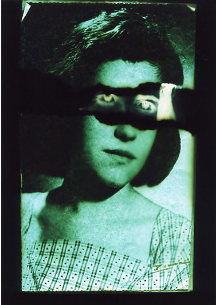
Figura 1. F_MIL_ALB_M (álbum de familia) , 2017 de Montse Morcate Fotograma químico color

a cada una de las imágenes del álbum familiar de un contenido que habla más de lo que se oculta detrás de cada escena y que se escapa a la capacidad propia del medio fotográfico para contarnos historias más allá del semblante de los retratados o de la información literal o sugerida que aparece en cada una de las imágenes, a menudo disfrazada u oculta por las convenciones de las propias fotografías en este ámbito.