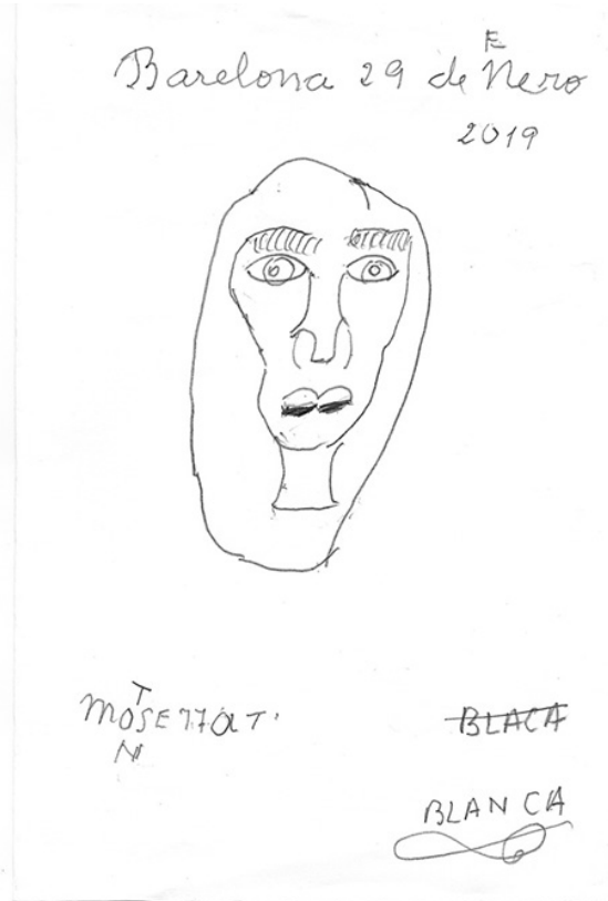
Figura 3. Uno de los dibujos realizados por la madre de la artista. (Auto)retrato: apuntes sobre el Alzheimer, 2019 de Montse Morcate

adaptarse a los constantes cambios cognitivos, físicos y emocionales del enfermo, tal y como muestran los dibujos.