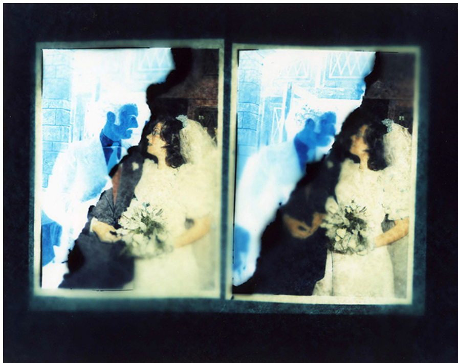
Figura 2. F_MIL_ALB_M (álbum de familia), 2017 de Montse Morcate Fotograma químico color