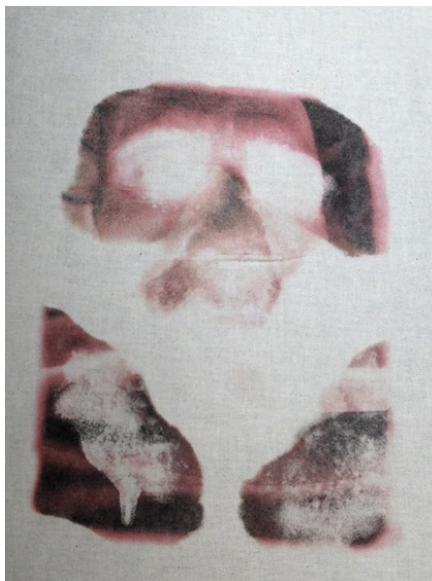
Figura 4. Imagen de una de las telas con la imagen transferida en negativo. Un último retrato , 2019 de Montse Morcate