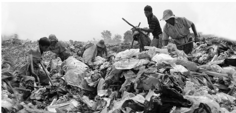
Fig. 5. Vertedero de un cinturón hiperdegradado en Sudamérica.

Un condominio del FMI y el Banco Mundial se les ha impuesto bajo la apariencia de proporcionar ayuda. (United Nations, 1999, p. 10)