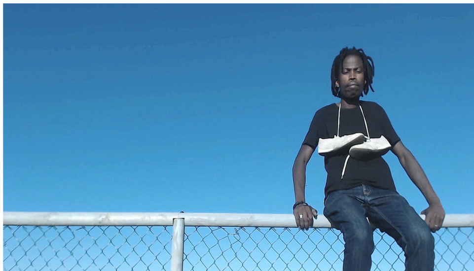
Fig. 1. Fragmento de la video proyección VGA.

Reactiva es una instalación audiovisual que reacciona a la presencia del espectador. Está integrada por una proyección VGA pregrabada (Fig. 1), con imágenes de un inmigrante en una valla fronteriza. Frente a la proyección hay un dispositivo similar a un trozo de valla con dos sensores de presión FSR, que invita al espectador a sentarse. Al detectar su peso, el primer sensor FSR desencadena un proceso de Tracking y una webcam captura al usuario para insertarlo en la proyección VGA mediante programación PureData (Fig. 2). Su presencia en la imagen junto al inmigrante subsahariano, le vincula a una situación ajena y distante, de la que generalmente sólo recibe información fragmentada.