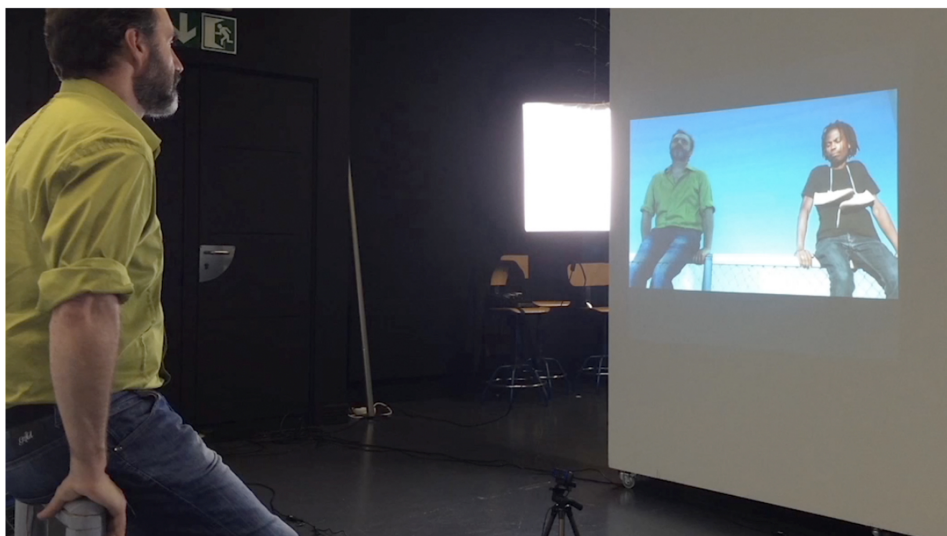
Fig. 2 Vista parcial de la instalación audiovisual reactiva.

Más que intentar provocar la sobre identificación con el que llega del otro lado de la alambrada, evocando el exotismo inventado por occidente que criticaba Edward Said, lo que se propone es visualizarse por un instante en esa situación entre fronteras en la que se encuentra el inmigrante, bloqueado en un espacio de tránsito, en tierra de nadie y en muchos casos sin el reconocimiento de sus derechos jurídicos como ciudadano. Esa representación que muestra al usuario sentado de igual a igual junto al llegado, supone una imagen sin los artificios del social fantasy como decía Homi K. Bhabha en El lugar de la Cultura . Al introducir al espectador en una situación ajena, proponemos un espacio in-between , un imaginario de identidad híbrida que diría Bhabha. Se trata de repensar la incidencia de la globalización sobre las migraciones, para comprender la redefinición de las ciudadanías.