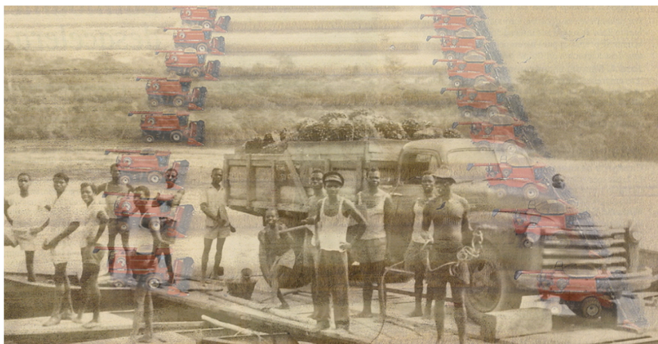
Fig. 6. Fragmento del video "Incidencia de la globalización en las migraciones".