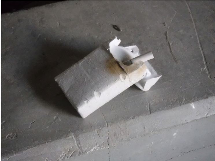
Figura 7. Mitsuki Akiyama, Una memoria , 2017