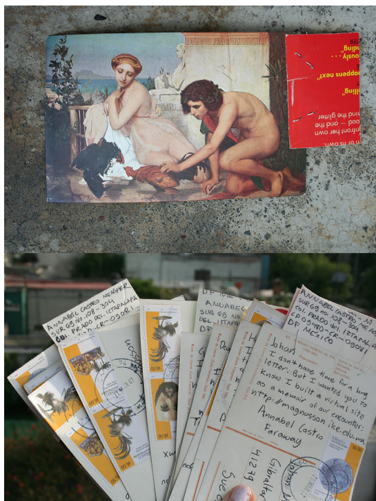
Figura 2. Postales con la dirección al sitio