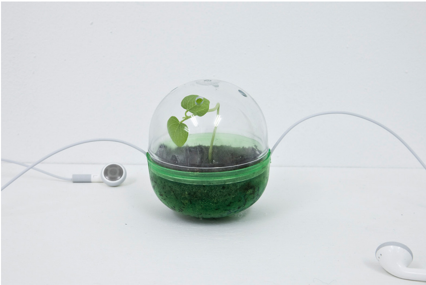
Figura 4. Atesorado , 2013

El alcalde de Chicago regaló un pez Sol a su visitante, el emperador Akihito, entonces príncipe titular de Japón. El obsequio invadió Biwa-ko de la prefectura de Shiga y devoró hasta dejar extintas varias especies nativas de ese lago tercero más viejo del mundo.