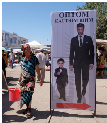
Figura 10. Mercado de abastos en Khiva.

El hecho de presentar la obra en un lugar en principio ajeno al arte (la Facultad de Ingeniería Agrónoma) constituyó un factor muy interesante, ya que aportó una percepción novedosa del hecho artístico. La realización de una obra artística en un contexto universitario, en donde se apreciaba una mayoría masculina, trataba de mostrar a través del vínculo floral la estrecha pero forzada vinculación de la mujer a la tierra y a los trabajos agrícolas o transacciones mercantiles en los mercados. Ante la pieza, el día de la inauguración de la obra, los espectadores -en su mayoría hombres, profesores y alumnos de la Facultad- manifestaban cierto desconcierto al no verse reflejados en las imágenes. Preguntaban: ¿y dónde están los hombres? (Fig. 9), los hombres estaban alrededor contemplando sí, la belleza que reflejan las imágenes, pero probablemente también las duras condiciones de vida de una agricultura de huerta, sin la suficiente maquinaria y el recurso de emplear a mujeres para ciertos trabajos cansados y duros. De esta forma, a través de lo visto y observado, la presencia femenina en las imágenes que componen la obra se transforma, y de ser un homenaje a la belleza ( Go'zallik en uzbeko) en general, a la belleza de las flores y de las mujeres uzbecas, pasa a visibilizar el contraste entre la alegría de las flores en la vestimenta de las mujeres y su situación social en relación a los hombres cuyos trajes son más austeros y cercanos a la forma occidental de vestir. (Fig. 10).