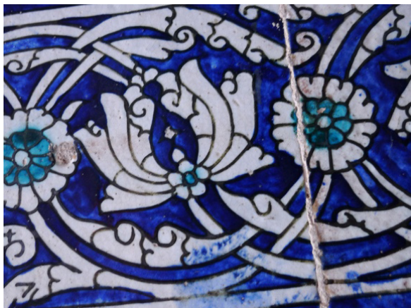
Figura 3. Azulejos en las mezquitas con ornamentos florales. Samarcanda..