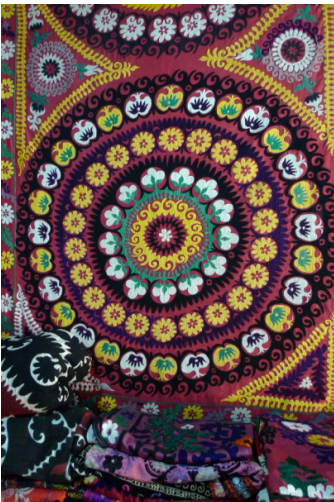
Figura 1. Suzani uzbeko..