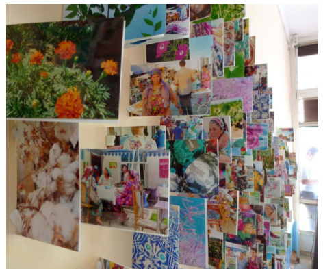
Figura 6. Exposición Go'zallik: Arte y naturaleza en Uzbekistán .