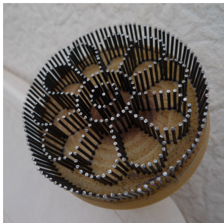
Figura 4. Sello floral para marcar el pan. (Foto: I. Abarca, 2016).