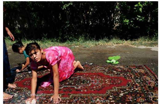
Figura 8. Niñas limpiando alfombras en medio de la carretera camino a Bukhara.

El conjunto de la pieza se configuraba como una metáfora de la estrecha relación entre las mujeres, el arte, la cultura, la naturaleza y la tierra, explorando la representación icónica de la naturaleza en los textiles característicos de la cultura, los tradicionales suzanis y en la abrumadora abundancia de elementos florales en los vestidos de las mujeres, especialmente en el medio rural, pero también en las ciudades. Esta visión prestaba especial atención al papel primordial de las mujeres como artesanas, poseedoras y continuadoras de las tradiciones.