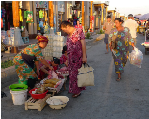
Figura 2. Mujeres en el mercado de Samarcanda. (Foto: I. Abarca, 2016).