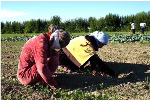
Figura 7. Mujeres campesinas trabajando en el campo. Samarcanda.

Retomando el concepto expositivo de la pieza, más allá de la belleza folclórica, el planteamiento artístico empleado permite visibilizar el papel de doble filo que juegan las mujeres. Por un lado, se pretendía evidenciar cómo estas se ven obligadas a mantener una conducta socialmente adecuada, adoptando los roles tradicionales y comportándose como la mujer modesta y virtuosa en el entorno familiar y por otro, se pretendía hacerlas visibles y perceptibles como trabajadoras dentro de la sociedad, más allá del uso de vestidos con flores que imponen las tradiciones o la religión. En el contexto universitario donde se realizó la obra (con una mayoría masculina), plantear una pieza artística -como experiencia abierta- en la que se ponían de manifiesto las cuestiones expuestas sobre la representación de la mujer era un ejercicio de carácter cooperativo-educativo, ya que propiciaba la visibilización de una realidad en evolución que daba un imaginario real a todas estas mujeres relacionadas con la belleza y el ornamento floral pero que sin duda trabajan duramente (Fig. 8).