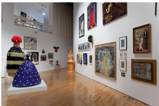
Figura 2. Vista de la exposición Caribbean: Crossroads of the World (2012) en el Queens Museum of Art.

En el Queens Museum of Art, Fluid Motions se movió en la dimensión de lo natural, dejando al contexto geográfico tomar protagonismo y, con este, también los conflictos geopolíticos. La cuenca creada por el Mar Caribe, al que se le ha llamado también el Mediterráneo americano, se constituye como espacio de confluencias e interconexiones, en el que los intereses comerciales de las metrópolis imperiales que han dominado históricamente el área han determinado en más de una ocasión su devenir. Aquí, las imágenes de puertos y navíos constituyen una constante y el mar es el protagonista indiscutible; Elvis Fuentes refiere, en su texto Crossroads, corssing and the cross : “it is through these ports that gods, people, ideas and information come and go, often crossing paths and picking up traces of each other along the way. Tracing the route could help us imagine the vastness and complexity of this web” (Fuentes, 2012, p.38).