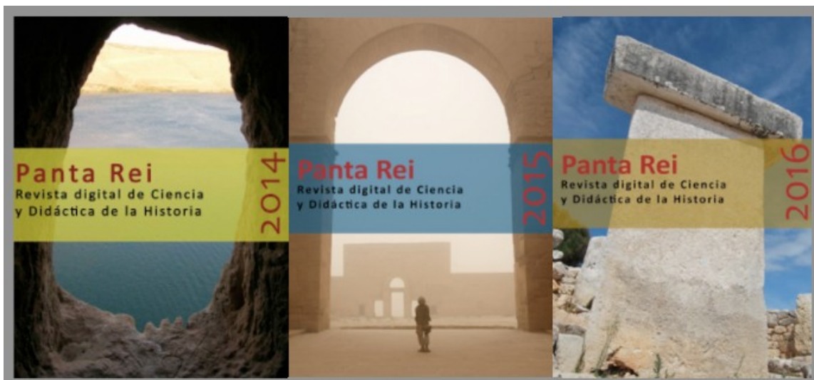
Figura 2. Título general de la figura. A la izquierda imagen del río Éufrates. Fuente: autor (o fuente). En el centro soldado norteamericano en la guerra de Irak. Fuente: autor (o fuente). A la derecha monumento talayótico en Menorca. Fuente: autor (o fuente). Montaje: elaboración propia.

Se adjuntará un listado de figuras donde se indique el número de figura y el título de la misma. Debe quedar clara, y señalarse expresamente, la autoría y/o procedencia de las imágenes.