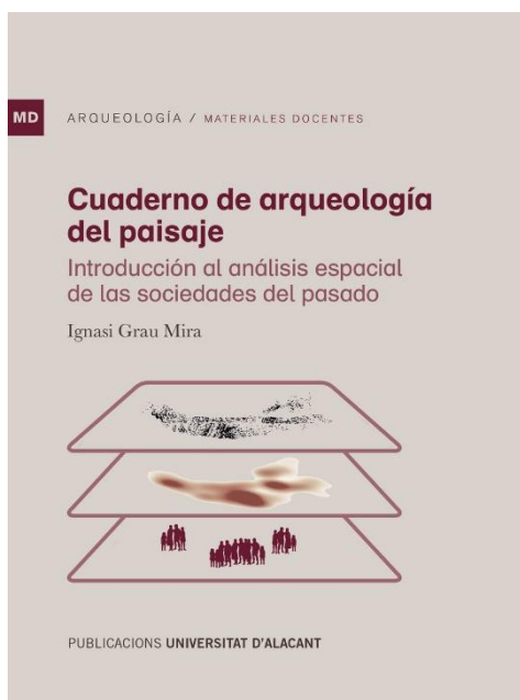
Figura 1. Portada del libro.

Recibido: 21/11/2022 Aceptado: 19/12/2023