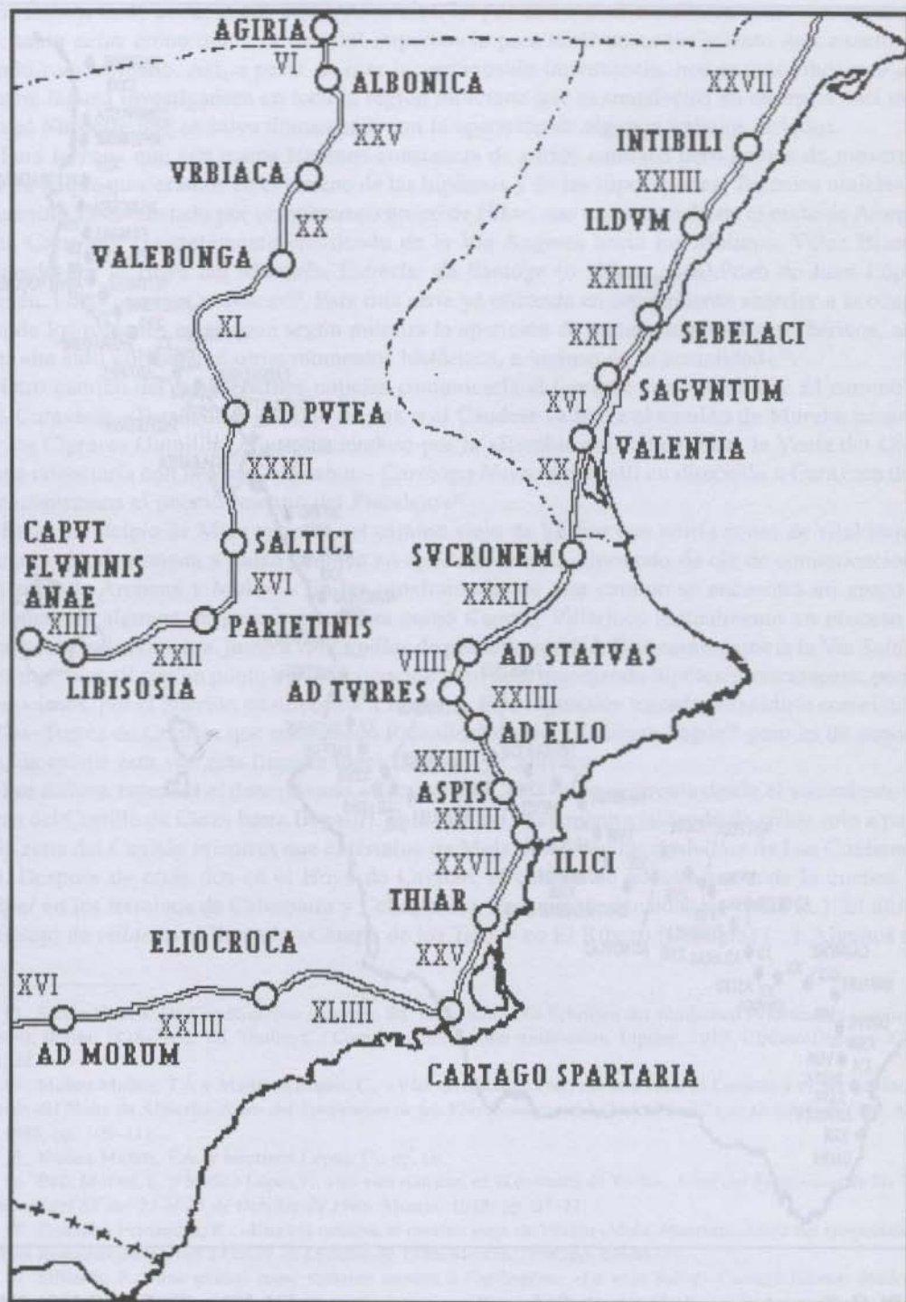
MAPA I. Las vías hispanas según el Itinerario de Antonino: el Sureste. (Según Roldán).